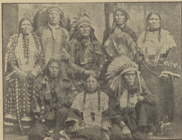
Grupp av indianhövdingar och indiankvinnor.