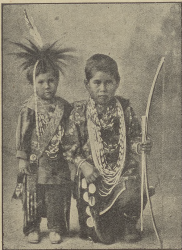
Barn tillhörande Fox-stammen.

Och far hade gjort sig så hård han kunde. — Bäst för dig, Lillmisse, som är