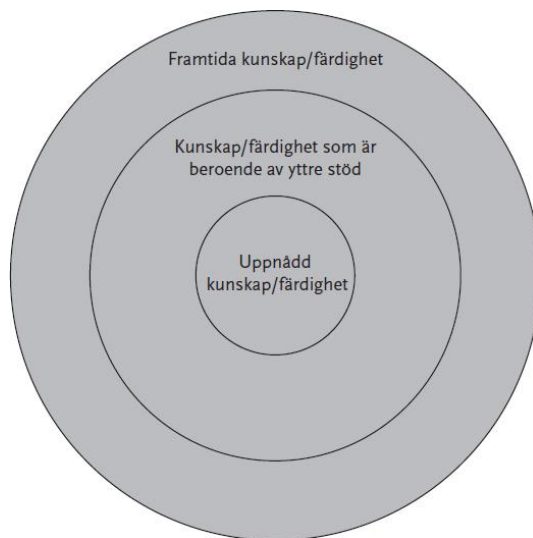
Figur 1 Den proximala utvecklingszonen 1

Den proximala utvecklingszonen lyfter Säljö (2022) fram som ett begrepp, som redogör för den kunskap en individ redan har. Kunskapen utmanas med hjälp av stöd till ett nästa steg i sin kunskapsutveckling. Det äger rum med hjälp av andra kunnande individer i gemenskap, då den kunnande förmedlar ämnet på ett stödjande och guidande sätt. Det kan kopplas ihop med begreppet scaffolding som enligt Säljö (2022) betyder just stöttning. Den mer kompetenta individen använder sig av scaffolding till den personen med mindre kunskap, genom att använda fysiskt och eller kognitivt stöd. För att stötta lärandet då individen approprierar nya erfarenheter. Vad stödet ska bestå av avgörs utifrån de kunskaper personen redan har innan. En ny kunskap etableras hos den person som får stöttning och det sker ständigt i det sociala samspelet. Den proximala utvecklingszonen beskrivs i figur 1 om de tre zonerna i barnets kunskapsutveckling som är, i den yttersta cirkeln kunskap som individen redan har, i mellan cirkeln behöver personen stöd, en knuff framåt för att nå ytterligare kompetens som individen inte klarar på egen hand, och den innersta cirkeln är kommande lärdomar (Säljö, 2022).