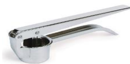
Figur 3. Vitlökspress 3

I följande avsnitt kommer vi att förklara hur vi gick till väga i de fyra aktionerna. En aktion beskriver Rönnerman (2023) är något som arrangeras för att pröva en åtgärd mot en förbättring som är tänkt. Vi tittade på hur barnen använde vitlökspressen och magneterna i lekaktiviteter då barnen leker själva utan vuxenstöd. För att sedan utöka leken med en stöttande pedagog som går in och förklarar vitlökspressens funktion och utmanar barnen att bygga ett stabilt bygge med magneter. Aktionerna utgick från två separerade lekar där vi valde att lägga till en artefakt i varje enskild lek. Artefakterna skulle locka barnen att pröva tekniska funktioner. Nedan kommer bilder på artefakterna och en förklaring. Vi kommer även att beskriva varje aktion var och en för sig och hur aktionerna gick till. Barnens, pedagogens och förskolans namn är fiktiva som Ahrne och Svensson (2022) lyfter som ett sätt att skydda de deltagande från att bli igenkända.