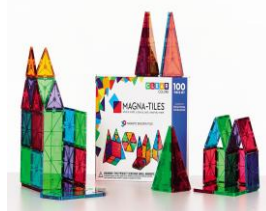
Figur 4. Magneter 4