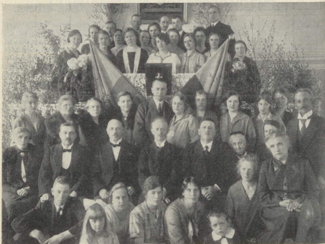
Gnesta frikyrkliga ungdomsförbund.