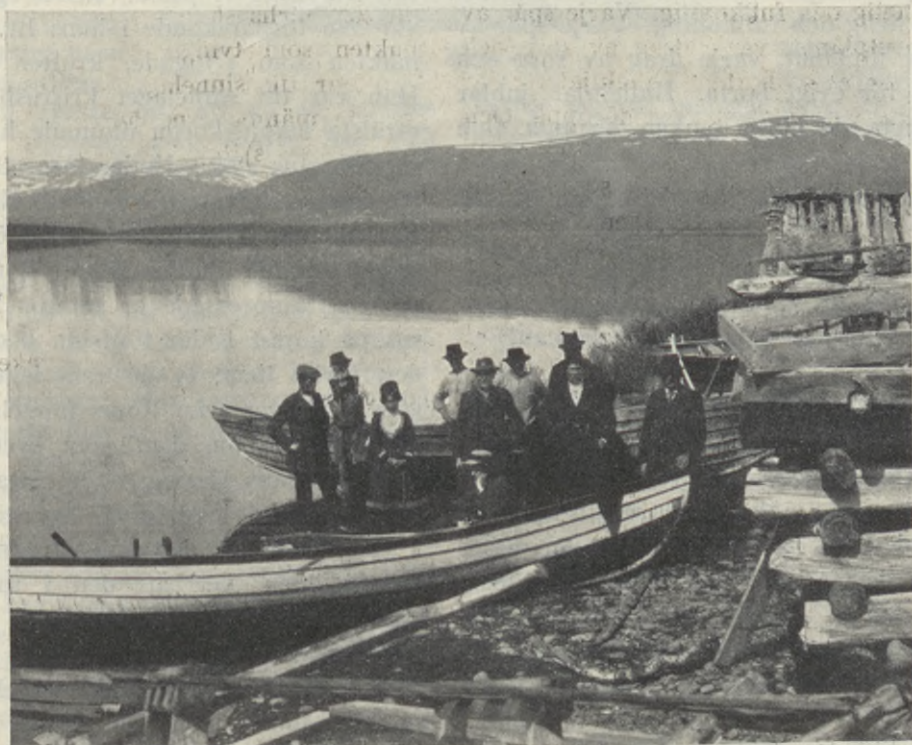
Från Jormvattnet, Jämtland. Till artikeln »Lappmäsas».