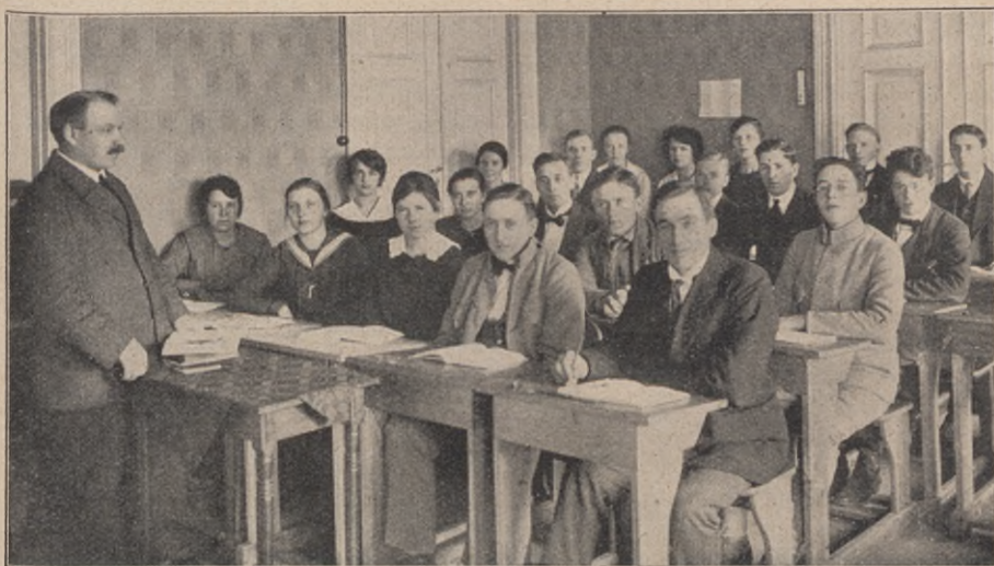
Bild från lärosalen.

Ett ungdomsfriskt och sunt kamratliv har gjort sig gällande i elevkåren. Det är ju så mycket vid en dylik skola, som är ägnat att förena de unga till en enda samskonkedja, såsom de gemensamma studierna, kamratlivet under raster, fritider, sam-