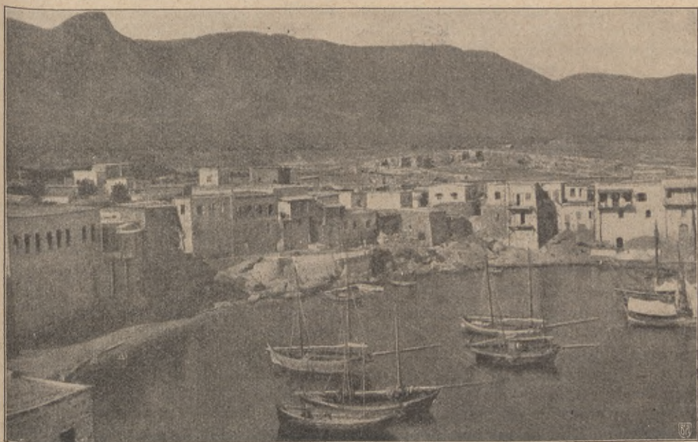
Pafos på Cypern.

Cypern, vars ytvidd är jämnt tre gånger Gottlands, genomlöpes av tvenne bergskedjor, vilka skiljas åt av en bred och fruktbar slätt. Den sydligaste av dessa kedjor uppbär en topp, som når en höjd av 1,800 m. Sedan urminnes tider har ön varit bekant för sina rika koppartillgångar. Under bronstiden spelade sålunda Cypern en mycket stor roll. Namnet »koppar» härleder sig också från namnet på