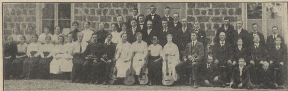
Hasselfors kr. ungdomsförening.

Kollekten gick till 260 kr., därav 70 kr. till Svenska Missionsförbundet.