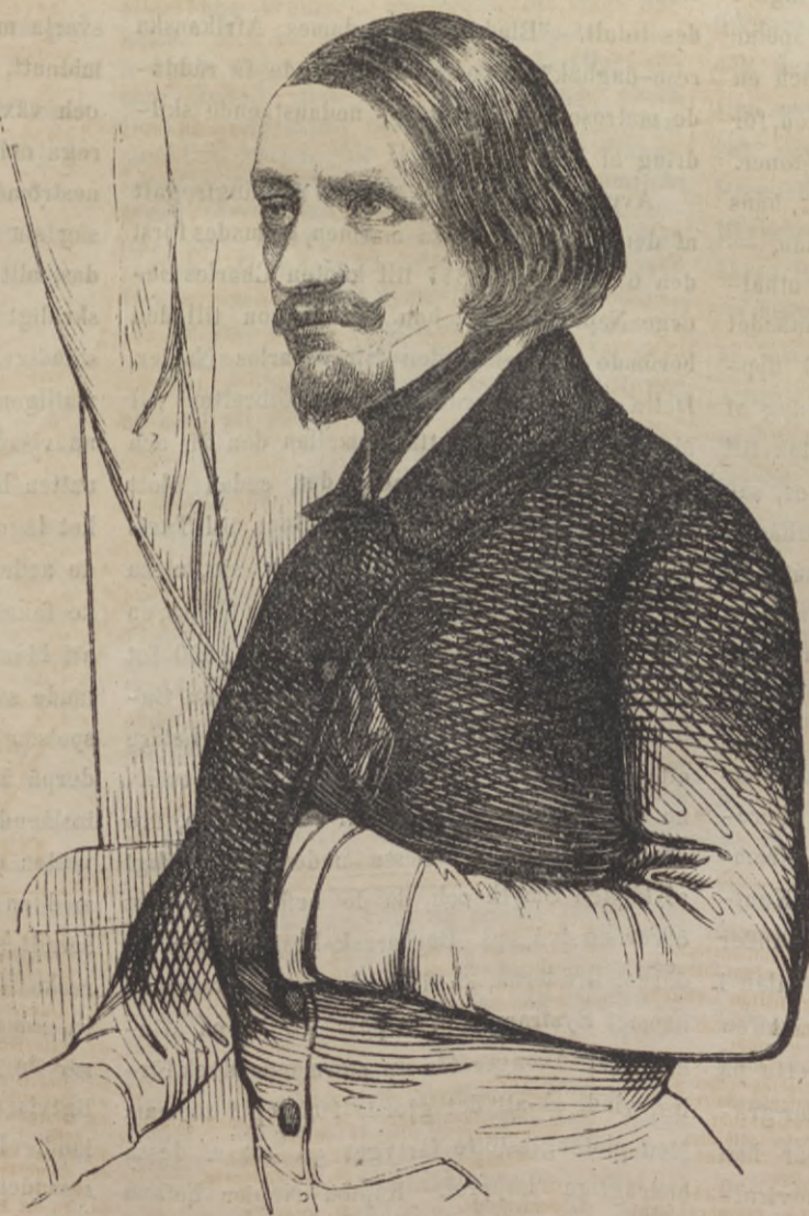
Apollinaire de Kontski.

Ej en gång de sednare händelserna hafva låtit konstnären tröttna på att verka för välgörande ändamål. Således gaf han i Strassburg, Mainz, Frankfurt am Main och Hanau konserter till förmån för de hemvändande Polackarne. I sistnämnda stad föll han på den