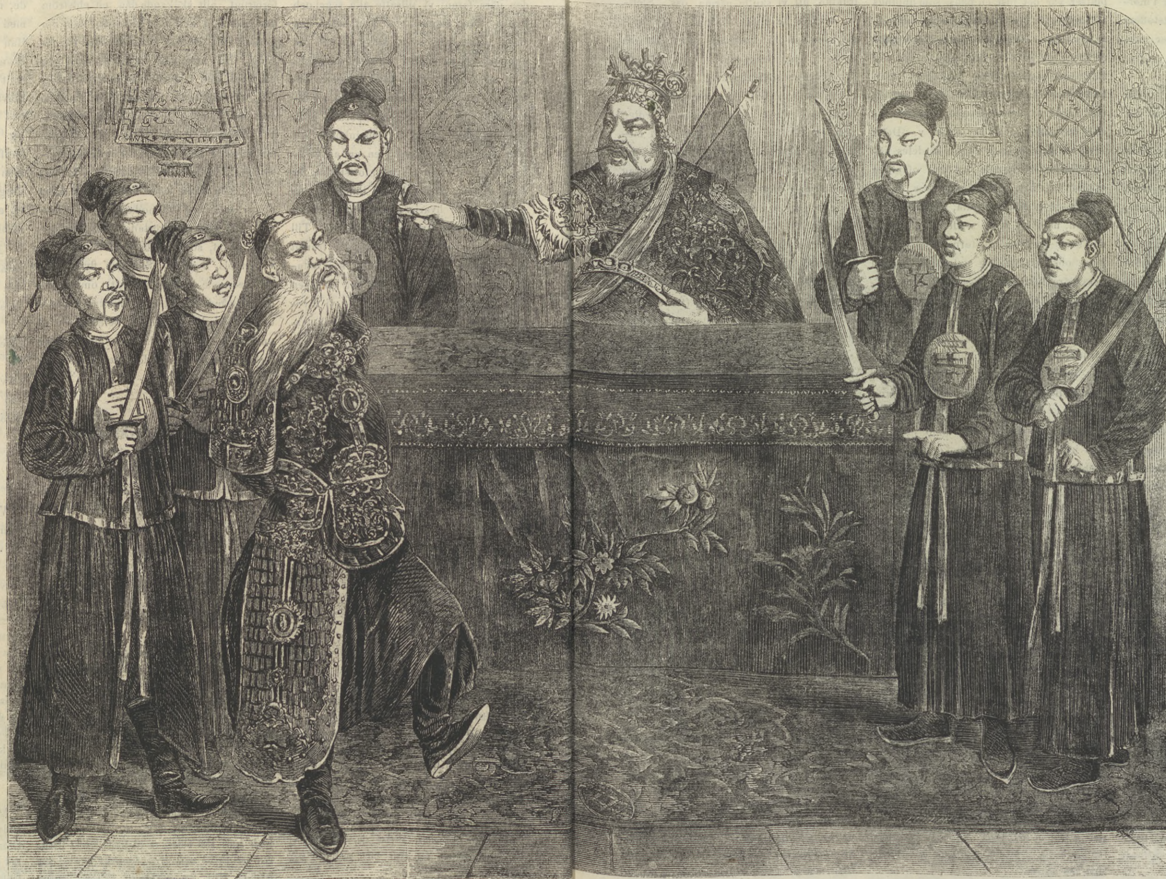
En afsatt Militär-Mandarin fört inför Guvernören i en provins.