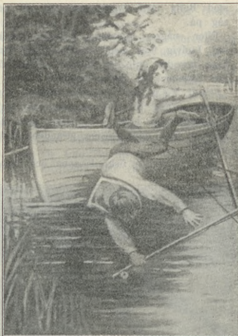
Han föll rak lång i floden.

Ett skrik undföll Betty, men förskräckelsen gjorde, att det fastnade i strupen, så att det inte hördes långt. Med en kraftig rörelse av årorna vände hon båten