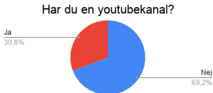
Figur 2 Cirkeldiagram över antal elever som har en egen Youtubekanal.

Vid frågan om eleverna har en egen Youtubekanal var det totalt var 24 elever som uppgav att de hade en egen Youtubekanal (30,8%). Varav 54 elever uppgav att de inte hade någon egen Youtubekanal (69,2%). Se figur 2.