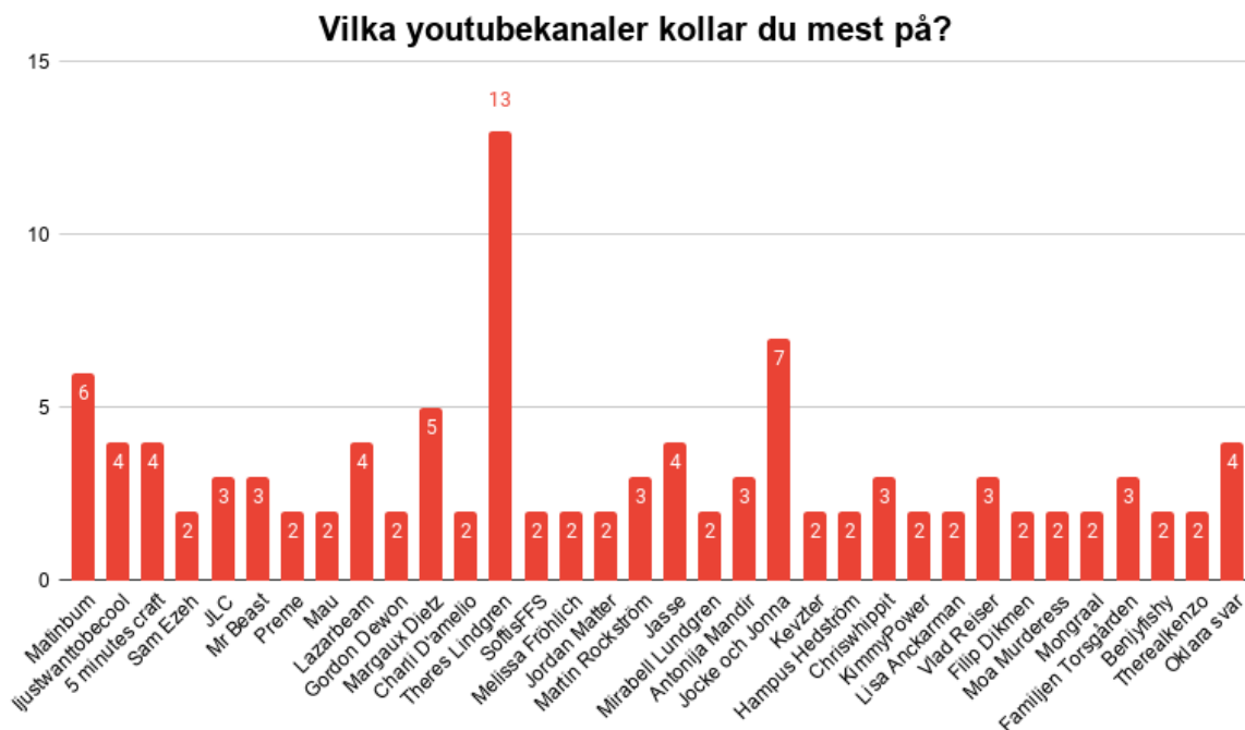
Figur 6 Stolpdigram över vilka Youtubekanaler eleverna konsumerar mest.

Det vi kunnat se är de Youtubers som eleverna tittar på är i åldrarna 10 år och uppåt. För en mer övergripande överblick se figur 6.