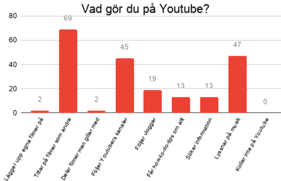
Figur 5 Stolpdigram över vad eleverna gör på Youtube.

I figur 6 presenteras vilka Youtubekanaler elever tittar mest på. Svartalternativen var inte fasta, utan deltagarna fick själva skriva vilka kanaler de tittade på. Detta ledde till att vi i sammanställningen sållade bort svartalternativ som endast framkom en gång. Totalt utgick vi från en empiri på 108 svar. Den kanal som var mest populär under undersökningen var Therese Lindgren (12,4%), därefter följt av Jocke och Jonna (6,5%) samt Matinbum (5,5%).