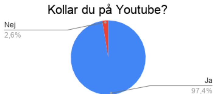
Figur 1 Cirkeldiagram över antal elever som tillbringar tid på Youtube.

Totalt deltog 78 elever i årskurs 4–5 i enkätundersökningen. Fördelningen av antal deltagare var 39 elever från årskurs 4 (50%) samt 39 elever från årskurs 5 (50%). Utifrån enkätsvaren framkom det att totalt 76 elever återkommande använder sig utav plattformen Youtube (97,4%). Detta resultat sammanfaller med den rapport Internetstiftelsen (2019) delgav. Varav 2 elever angav att de inte tillbringade någon tid på plattformen (2,6%). Se figur 1.