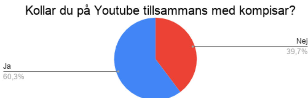
Figur 3 Cirkeldiagram över antal som tillbringar tid på Youtube tillsammans med kamrater.

Totalt var det 47 elever som angav att de tillbringar tid på plattformen tillsammans med kamrater (60,3%). Varav 31 elever angav att de inte tillbringar tid tillsammans med kamrater på plattformen (39,7%). Se figur 3.