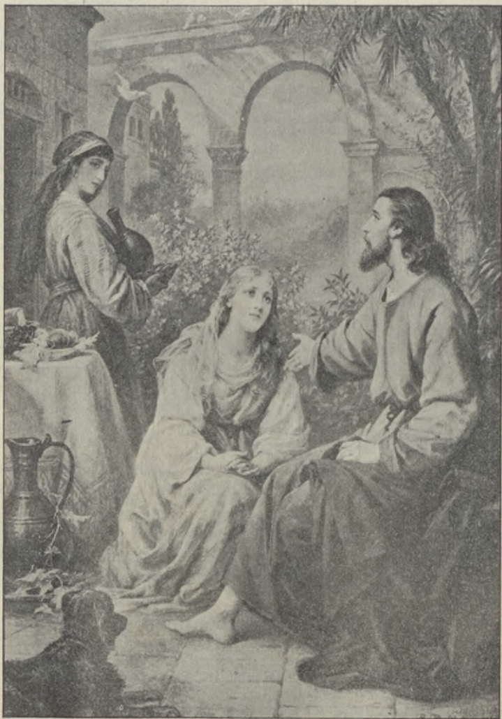
Trygg hos Jesus.