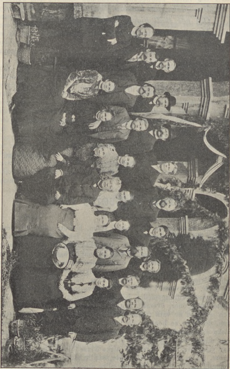
Missionskonferens i Kina.