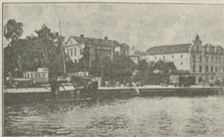
OSKARSHAMN: PARTI AV HAMNEN.

Äntligen! Pustande och långsamt kom tåget in på stationen. Diktorn stod där