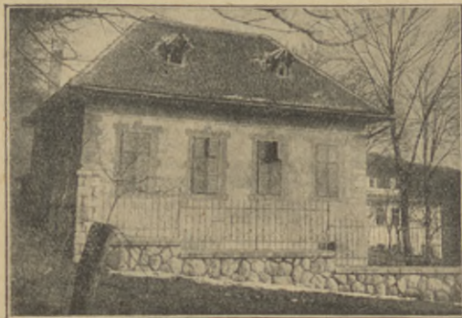
Svenskhuset i Budakezi i Ungern.

Bertil ville fly. Hade han inte brutit sitt löfte till far och givit efter för sin smärta. Och detta just i kväll, när han överenskommit med far att försöka vara särskilt glad och ståndaktig.