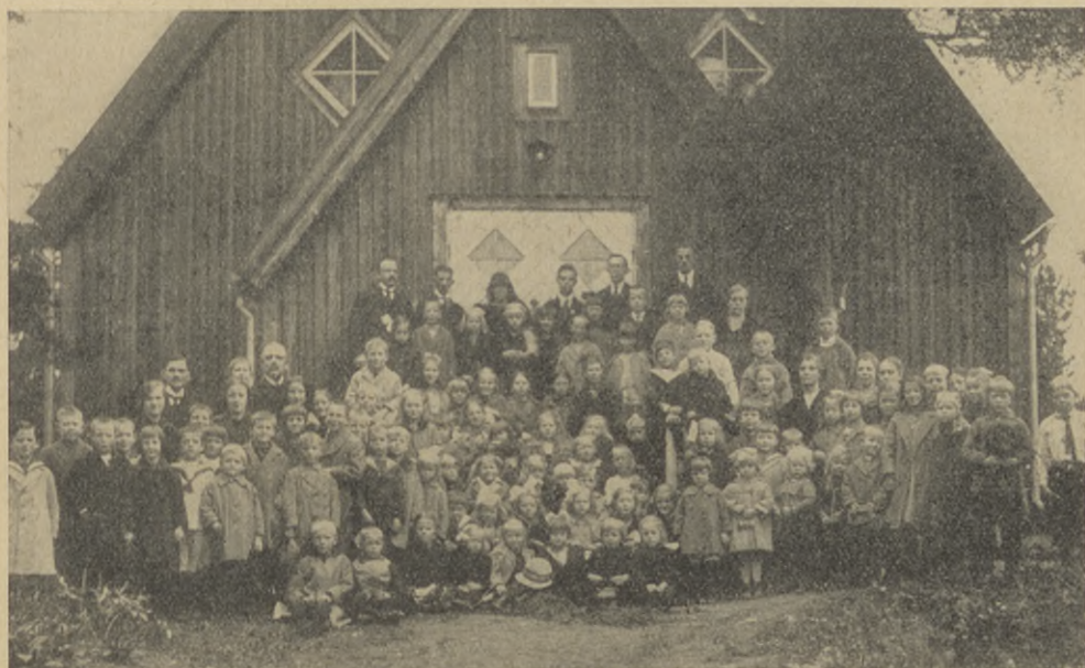
Söndagsskolan i Örby kapell.