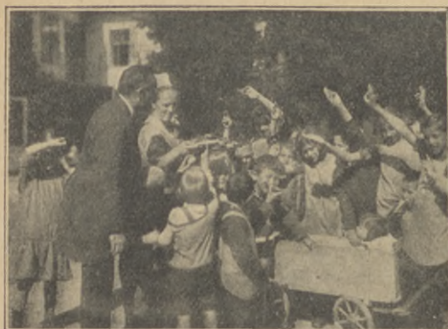
Från barnhemmet i Türrnitz i Österrike.

och ibland ömt strukit honom över håret och sagt några starka, innerliga ord, som för en stund kunde göra honom helt lycklig och glad och jaga bort saknaden.