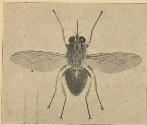
Tsetseflugan. storleken som en vanlig husfluga.)

Tse-tseflugan, genom vilken sjukdomen överföres, liknar en vanlig husfluga till färg och storlek, men har i