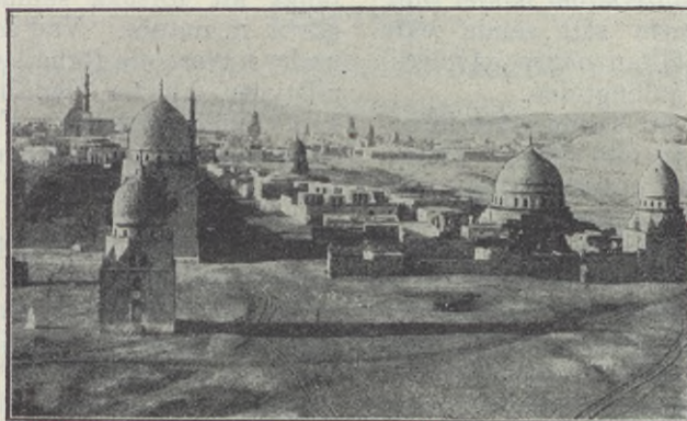
Kalifernas gravar i Kairo.

Stor är den kristna församlingens missionsuppgift i Afrika. För att kunna fylla den och gemensamt sluta upp i