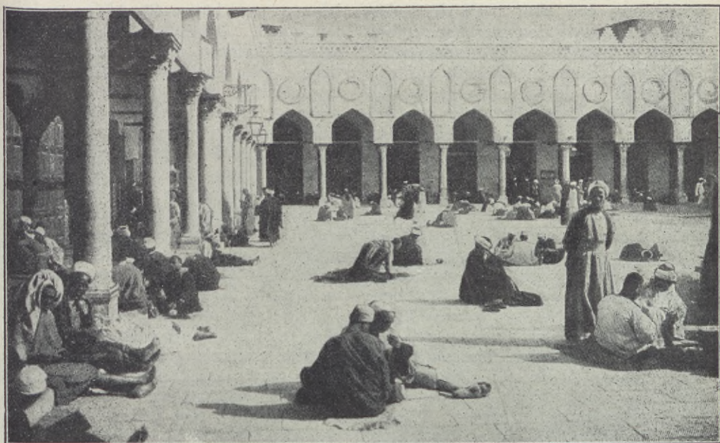
Interiör av El-Ahzar-universitetet i Kairo.

allt emot kristen sådan och är angelägen att få kristna lärare i sina skolor hellre än muhammedanska, emedan de betrakta islams herravälde i Afrika absolut oförenligt med sina intressen». — Engelska regeringen har dock gjort islam många ovärderliga tjänster. Så t. ex. har den lämnat medel till byggnad av moskéer, i Egypten har den anbefallt hållande av muhammedanernas vilodag och t. o. m. tvingat sina hedniska soldater att omskära sig, allt för att behaga muhammedanerna.