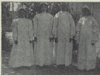
De senast döpta vid Jarkend.

Våra vänner, som år efter år troget stått vid vår sida, skola säkert glädjas med oss över att ljusare tider i vårt arbete synas inbryta.