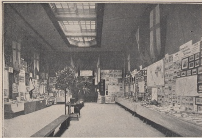
Bild från missionsutställningen.

I anledning av konferensen var i K. F. K. M:s gymnastiksal anordnad