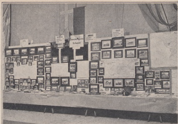
Från missionsutställningen. Missionsförbundets utställning.

en högst intressant utställning av sådana föremål, som stå i direkt samband med missionsarbetet. Utställningen, som omfattade specialkort, fotografier, böcker, traktater, reseutrustningar, slöjdalster m. m., var avgiftsfritt tillgänglig för alla, som voro försedda med ombuds- eller deltagarkort .