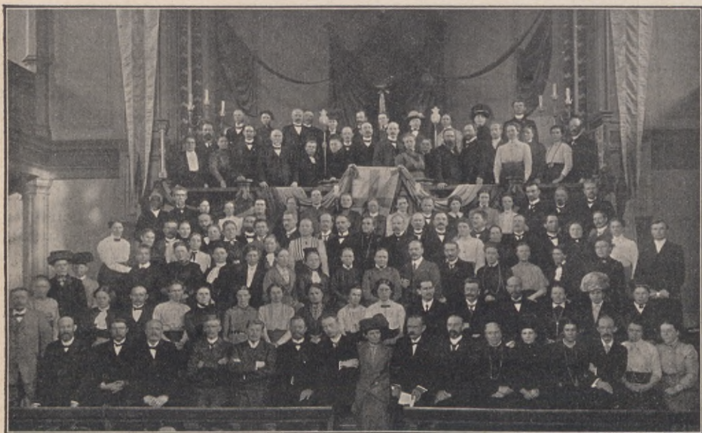
Det stora missionärsmötet.

Svenska Kyrkans Mission 4, Svenska Missionsförbundet 6, Baptistsamfundets Mission 2, Kviunliga Missions-Arbetare 2, Svenska Missionen i Kina 1, Skandinaviska Alliansmissionen 1, tillsammans 16 missionärer. Ett angenämt samkväm med kaffe-