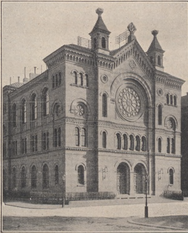
Betesdakyrkan, där förhandlingarna hölls.