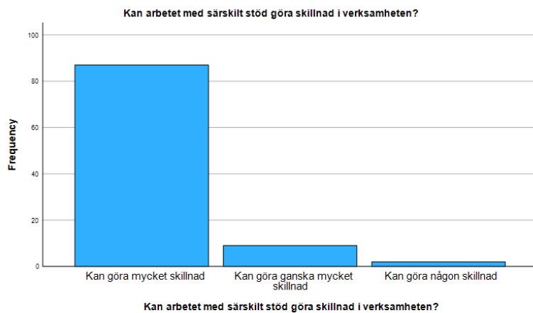
Diagram 2 - hur respondenterna ställer sig om särskilt stöd kan göra skillnad i förskolans verksamhet.

bland annat resurser och kollegor. En respondent uttalade sig om hur kollegor har beskyllt barnen på deras problem och beskriver även att det blir lätt att de utan kompetens inom området tycker att barnet ska anpassa sig till miljön, och inte miljön som anpassad för barnen. Precis som tabellen visar är det också flera respondenter beskriver också hur viktigt de anser att arbetet med särskilt stöd är. Respondenterna uttrycker då att de anser att det är viktigt att fånga upp dessa barn som är i behov av särskilt stöd redan i förskolan för att kunna ge barnet en så bra skolgång som möjligt. De lyfter även hur det är förskollärarna som ansvarar för att skapa förutsättningar för barnen och att särskilt stöd är en stor del av att kunna skapa dessa förutsättningar, för att barnen ska kunna utvecklas så långt som möjligt.