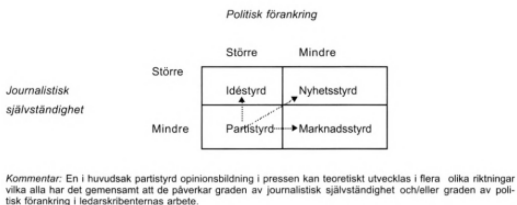
Figur 3.3.1 Möjliga utvecklingsvägar för framtidens ledare (Nord, 2001)

Fortsättningsvis menar han att, med tidigare nämnda kriterier som utgångspunkt, partipressen har starkare politisk förankring och inte är lika journalistiskt självständig. Då framtidens ledare måste förhålla sig till båda dessa parametrar, presenterar Nord en modell som representerar potentiella utvecklingar för ledarjournalistiken i svenska tidningar (ibid). Denna går att skåda nedan.