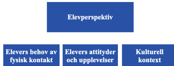
Figur 2. Överblick av resultatet för elevperspektivet.

I de valda artiklarna framträder tre underteman i relation till elevperspektivet; (1) elevers behov av fysisk kontakt, (2) elevers attityder och upplevelser och (3) skillnader i olika kulturella kontexter. Nedan presenteras en genomgång av dessa teman.