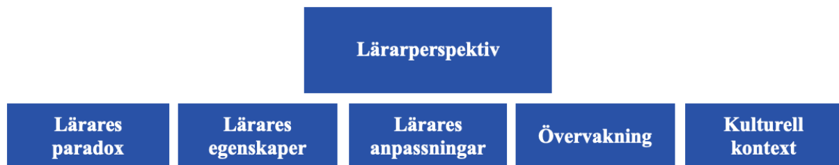
Figur 1. Överblick av resultatet för lärarperspektivet.

I de valda artiklarna framträder fem underteman i relation till lärarperspektivet; (1) lärares paradox, (2) lärares egenskaper, (3) lärares anpassningar, (4) övervakning och (5) kulturell kontext. Nedan presenteras en genomgång av dessa teman.