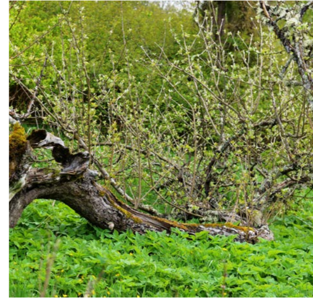
Slutet närmar sig... eller? Det 150-åriga trädet har fallit men ännu finns en remsa bark med ledningsvävnad kvar som har kontakt med roten. Det är nu hög tid att ta vara på ympris för att just det här trädets egenskaper ska bevaras. Man kan också leda upp ett par av de unga skotten och låta dessa utvecklas till nya små träd. Genom att kupa upp jord kring skottbaserna kan man få en rotning direkt från de unga skotten. Lyckas det kan man så småningom välja ut det bästa skottet till att bilda ett nytt träd. Rotade skott kan också ges en ny växtplats i anläggningen.

De stegar som förekommer på marknaden är i de allra flesta fall godkända av Statens provningsanstalt, numera kallad RISE. En godkänd stege kan ha tre alternativa märkningar som visar detta: SP-märke, RISE eller EN131. Någon av dessa märkningar är ett absolut krav för en stege som ska användas yrkesmässigt. Tyvärr innebär det inte att en godkänd stege automatiskt är lämpad för beskärningsarbete. Enkel- och utskjutsstegar för byggändamål kan vara mycket robusta men kan samtidigt vara mycket tunga vilket i sig innebär att man får en sämre ergonomi i arbetet. För ett bra beskärningsarbete är det viktigt att regelbundet kunna flytta stegen till en bra position.