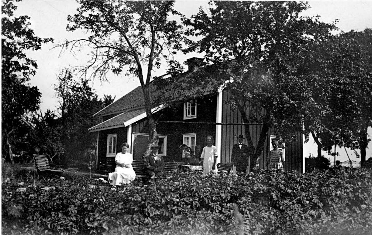
Höga fruktträd på Vallby Sörgården, Västergötland, omkring 1926.

När beskärning gjordes var den vanligen inte särskilt omfattande, utan inskränkte sig till gallring av enstaka grenar. Däremot var man ofta noga med skötseln av marken kring träden. Det var vanligt att hålla öppen jord runt träden och många gånger kalkades även stammarna årligen. Att kalka eller "krita" stammar gjordes ofta i kombination med borstning och skrapning av träden. Metoden förklaras närmare längre fram. Det är intressant att jämföra detta med vår tid då det numera råder ett i det närmaste omvänt förhållande. I hemträdgårdar beskärs träden årligen ofta mycket hårt, medan marken under träden nästan undantagslöst är en sluten gräsyta. Kalkning av stammar är en i stort sett en försvunnen trädvårdsåtgärd.