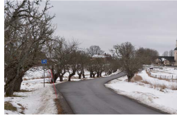
Asknäs fruktträdssallé, Ekerö.