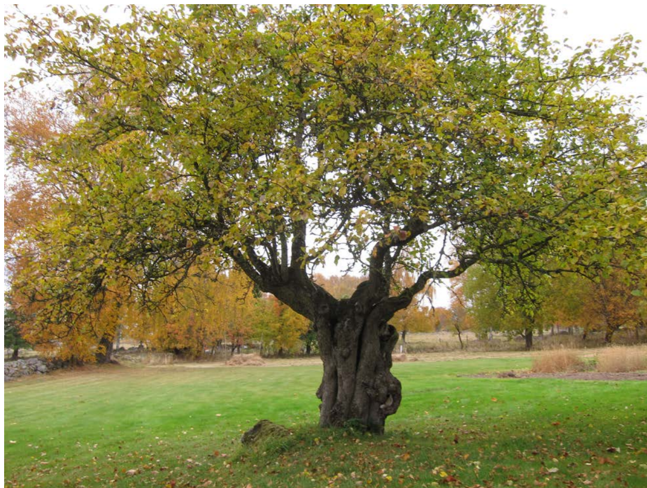
Gammal, vacker apfel inom Kulturresevatet Vallby Sörgården, Västergötland. Trädets ympställe är väl synligt. Trädet kan vara planterat på 1700-talet och är trädgårdens äldsta bevarade växt.

Det är också viktigt att förstå den miljö och det sammanhang trädet befinner sig i. Ett träd i en slotts-trädgårds före detta fruktodling har förmodligen en annan beskärnings- och skötselhistorik än trädet vid det gamla torpet.