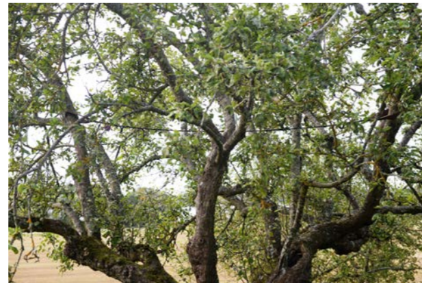
En kronstabiliseringslina har monterats i kronans övre tredjedel. Observera att linan monteras så att den slackar ca 1 cm/meter. Det ger trädet en viss rörlighet – vilket det normalt ska ha.