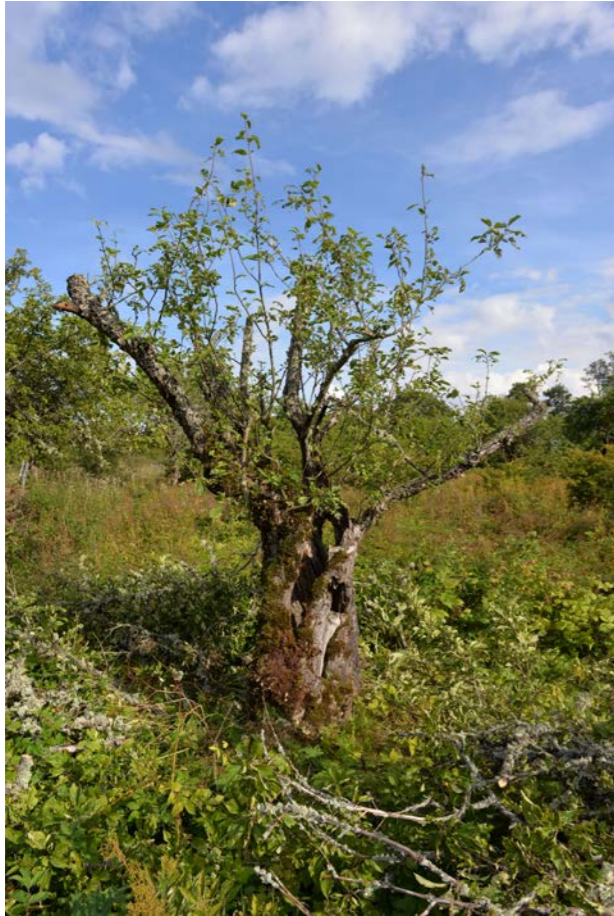
Kronan har sänkts till en lägre nivå där det ännu finns vissa begränsade förutsättningar för fortsatt tillväxt. De mekaniska påfrestningarna på den sköra stammen är nu betydligt mindre. Om trädet hålls i den här storleken kommer det inte att kollapsa än på ett bra tag. Som alltid ska ingreppet följas upp. Kronan kommer efter hand att få en vackrare form.