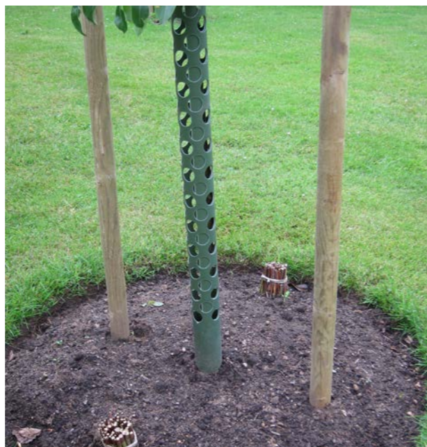
Öppen jord kring nyplanterat träd. Observera två knippen av lindskott som hjälper till att leda ner vattnet i hela rotzonen, en historisk lösning hämtad ur äldre trädgårdslitteratur. Rekonstruktion vid Fredriksdals friluftsmuseum, gjord inom Hantverkslaboratoriets projekt Utvecklande skötsel av kulturhistoriskt värdefulla parker och trädgårdar.

Finrötter som skärs av återbildas snart. Men grävgrepen grepar man sedan upp grästorvor bit för bit tills rundeln är frilagd. Därefter tillför man lövkompost som mulch. Man kan också välja att enbart hålla öppen jord i rundeln – något som ger ett bättre intryck i en historisk miljö än t.ex. mulchning med träflis. I sådana fall behöver inte rundeln vara så stor. Välbrunnen stallgödsel är en jordförbättring/gödsling som har varit väldigt vanlig historiskt men som idag är svårare att få tag i på grund av striktare regler för gödselhantering i lantbruket.