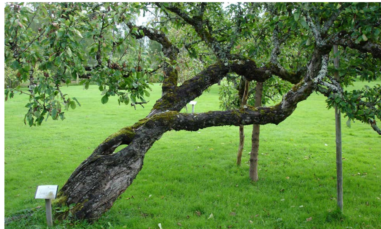
Ett träd helt beroende av stöttning.