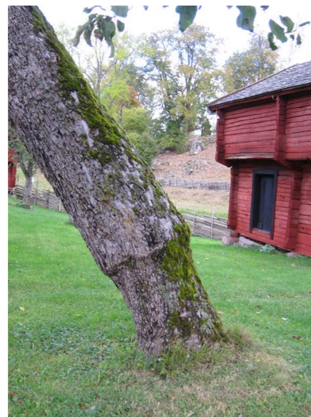
Ett äldre träd av ’Gravensteiner’ där ympstället syns tydligt. Kulturresevatet Stensjö by, Småland.