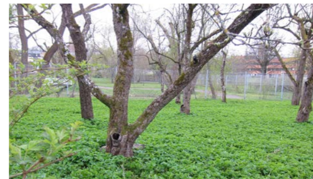
Idag är det bara de stora snittytorna i nivå med kirskaalen som avslöjar att detta en gång var träd på lågstam.