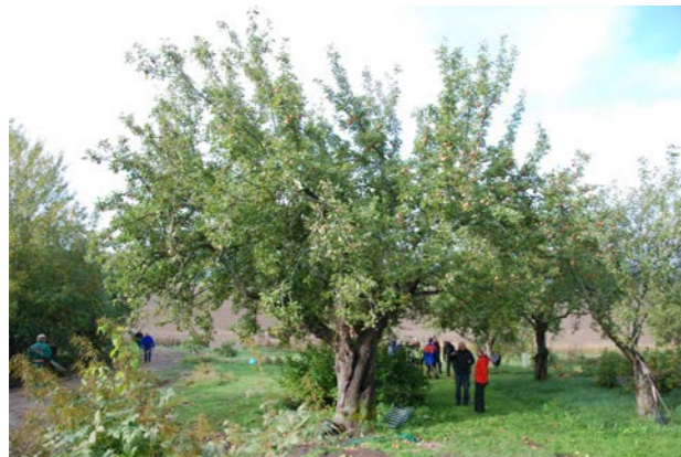
Ett gammalt Åkerörträd har fått en tät och vid krona som resultat av en kraftig stympning för många år sedan. Trädet har också en försvagad stamförgrening. Kronan behöver gallras, reduceras, avlastas och troligen också stabiliseras.

numera speciella flexibla, vävda linor. I vissa fall görs en kombination av både flexibla och statiska linor. Kronstabiliseringen monteras på ett sådant sätt i kronan att den gör mesta möjliga nytta utan att störa trädets rörelser. Det är bra om en kronstabilisering inte är alltför iögonfallande då den kan kännas främmande i en historisk miljö. Montering ska alltid kombineras med avlastande beskärning. Det här är ofta ett jobb för en erfaren arborist eller trädvårdare. En felaktigt monterad kronstabilisering kan skapa nya risker.