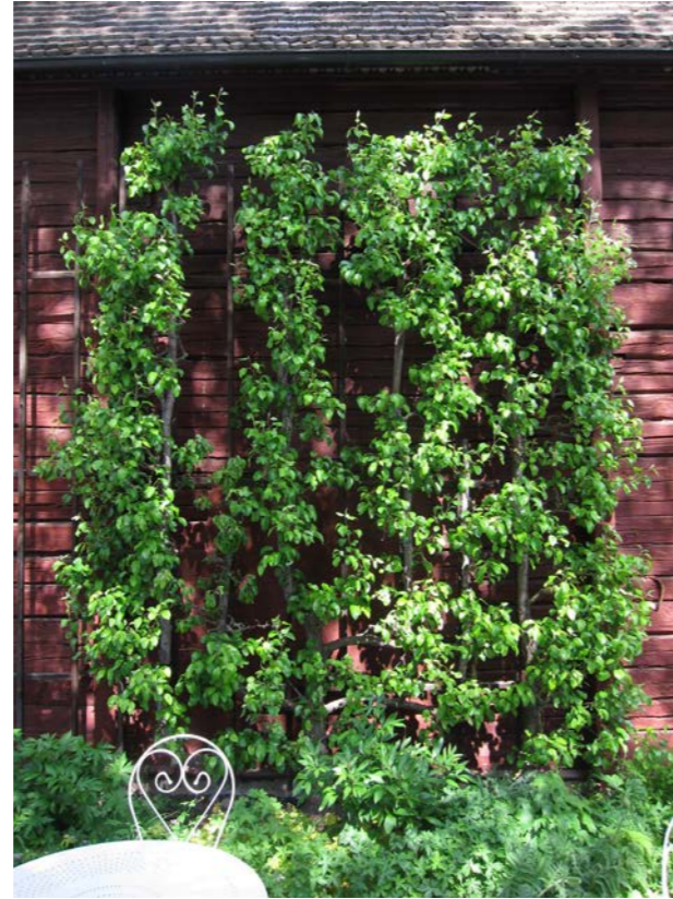
Gammal verrierpalm mot mur i Alnarp (t v). Spaljérat träd i friluftsmuseet Gamla Linköping (t h).

Formträd av olika slag, främst spaljerade äppel- och päronträd, fick också ganska stort genomslag i hemträdgårdar. Med rätt skötsel var de trädgårdsägarens stolthet, men de intensivskötta och kunskapskrävande träden blev med tiden ofta eftersatta och växte ur sina former. Det finns ännu en del gamla, i grunden fina, spaljéträd kvar vid äldre fastigheter vilka är möjliga att restaurera. Fasadrenoveringar och dräneringsarbeten kring husen har dock lett till att de flesta tyvärr har försvunnit.