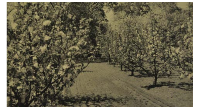
... som såg ut så här på 1930-talet. Marken hölls öppen för att ge träden bästa möjliga förhållanden och gav dessutom möjlighet till odling av mellankulturer som grönsaker och snittblommor. Östergötlands museums arkiv.