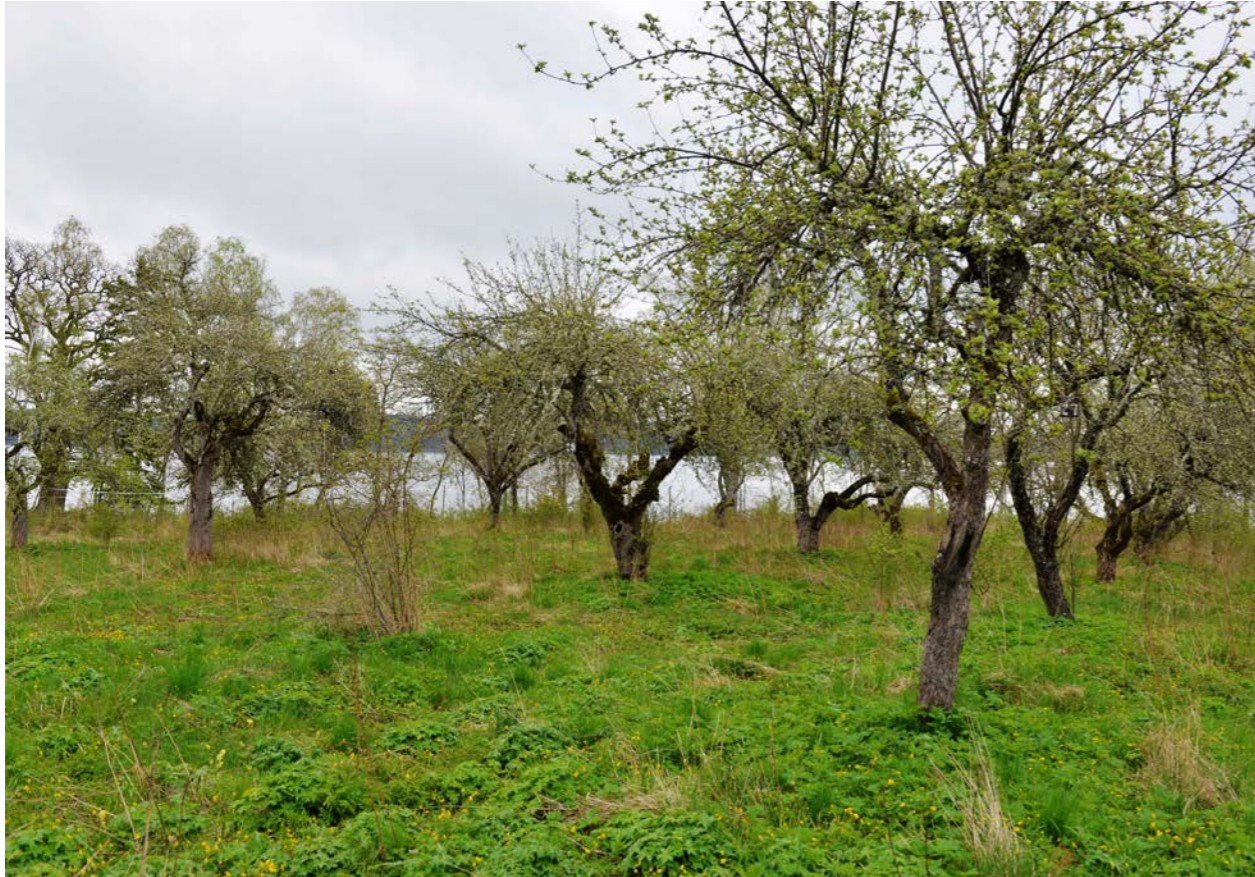
Kvarstående originalträd i en av Olof Eneroths provodlingar i Sörmland.

upp under seklets första årtionden planterades ett stort antal fruktträd – träd som i många fall står kvar än idag. För utvecklingen av både hemträdgårdssodling och yrkesfruktodling spelade länsträdgårdsmästarna en särskilt viktig roll.