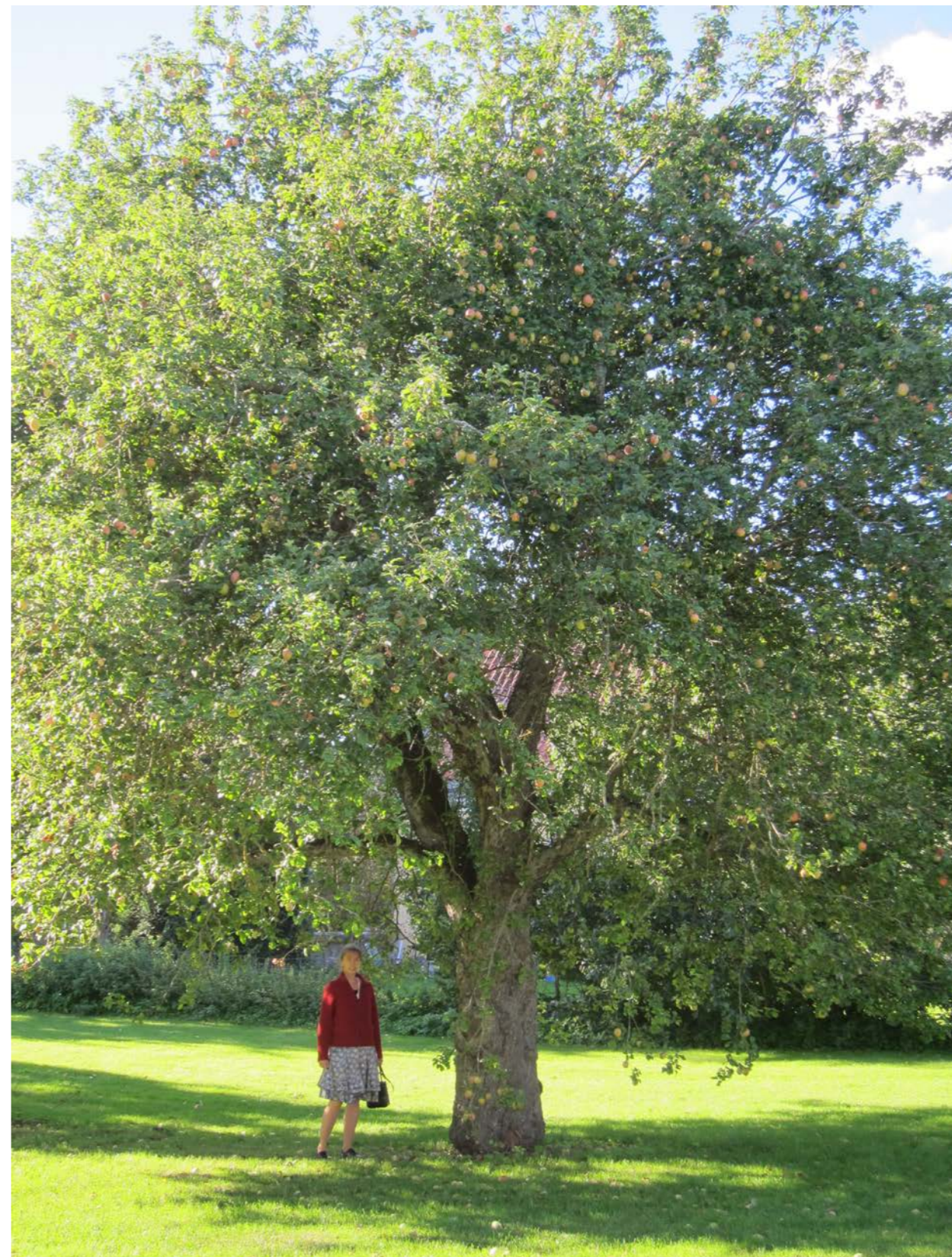
Ett omkring 100 år gammalt Melon-äppelträd. Trädet är ympat på fröstam vilket givit ett mycket högt träd.

Arbetar man med en fruktträdgård där man historiskt odlat så kallade dvärgträd och lågstamsträd så blir frågan den omvända. I sådana fall kan ett träd på A2 komma att få fel proportioner. Här får man skapa lämpliga träd genom att starta från ettårsspön på svagare grundstammar ur M- eller MM-serien. Den nya, mycket härdiga B9 är tyvärr i många fall alltför svagväxande.