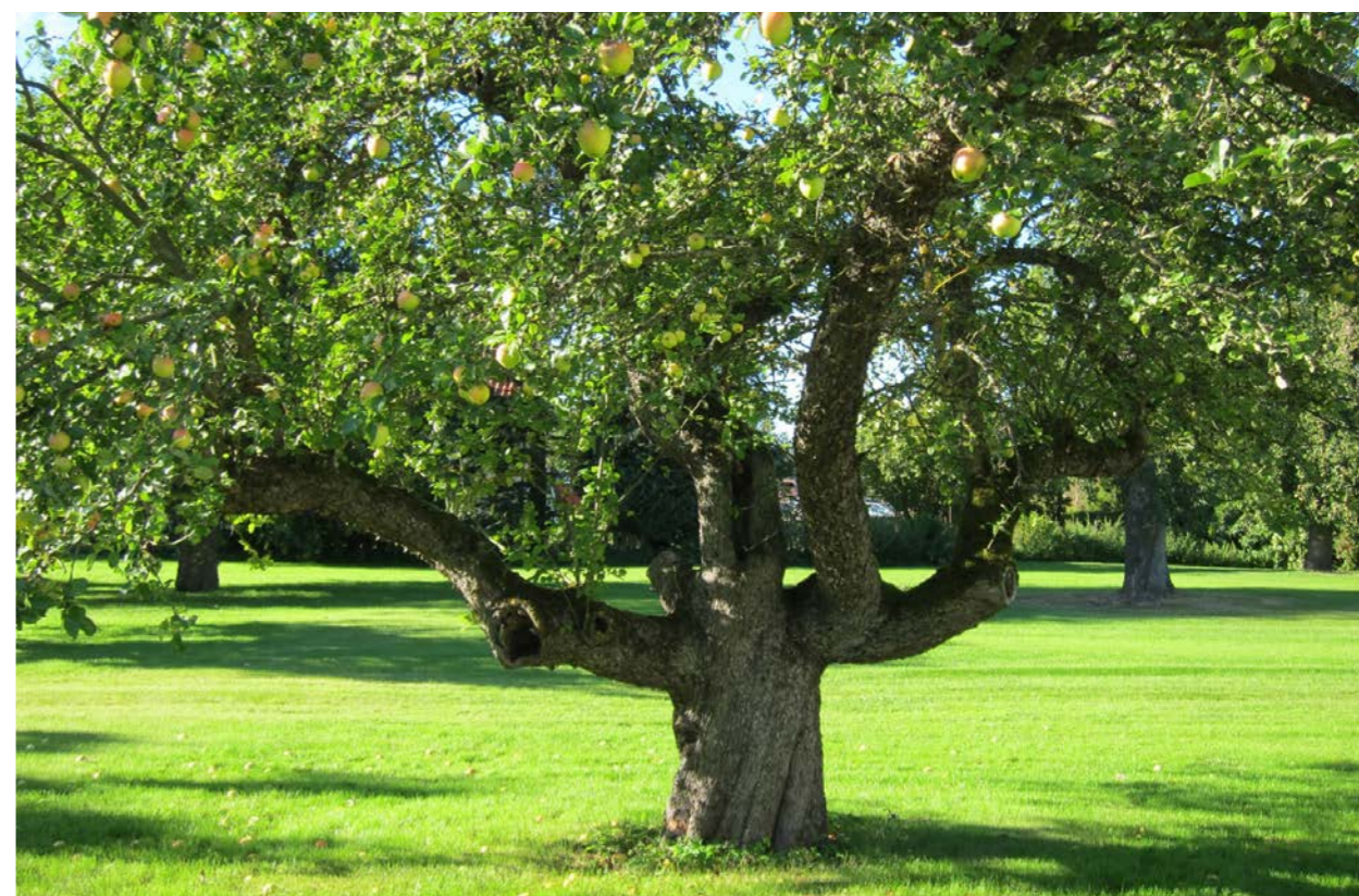
Hundraårigt exemplar av 'Arreskov' med stora motorsågssnitt.