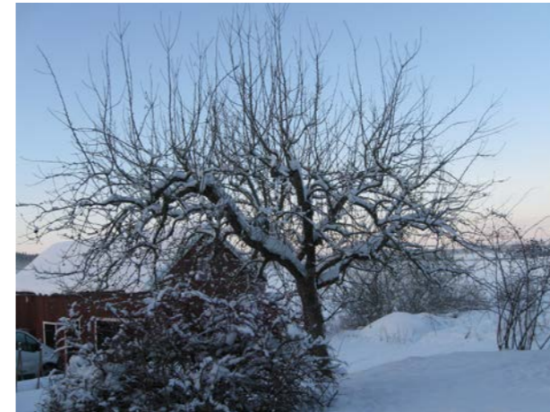
Ett beskränningsskadat träd av 'Stor Klar Astrakan' där kronans övre del kapats rakt över ca tio år tidigare. Trädet svarade med att producera en mängd vattenskott som nu bildar nu en skog av "träd i trädet".

Ofta står man inför fruktträd där någon tidigare gjort radikala ingrepp som sedan inte följts upp. Många gånger har trädet blivit av med hela övre kronhalvan. Trädet har svarat med kraftig vegetativ tillväxt i form av mängder av vattenskott. Trädet är snart uppe i samma höjd igen men är nu mycket tätare. Ljuset släcks ofta i kronans nedre del.