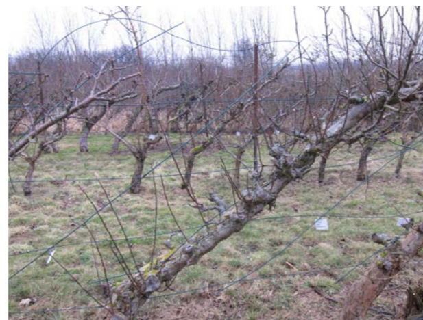
Kordongträd från 1960-talet under påbörjad restaurering, Alnarp.

ett flertal sorter. Liksom när det gällde vanliga spaljéträd medförde ofta bristen på kunskap att kordongträden