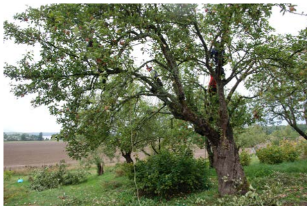
Hela kronan gallras här under sensommaren. Långa grenar reduceras vid förgreningar. Kortare och välriktade grenar lämnas obeskurda.