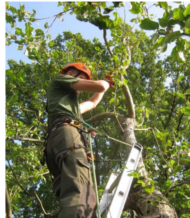
Sele och positioneringslina ("sidostropp") ger steganvändaren extra stöd och säkerhet. Två fria händer är bra!

En kortare utskjutsstege gör det lättare att komma åt i träden, jämfört med om man behöver baxa runt en fast men för lång stege.