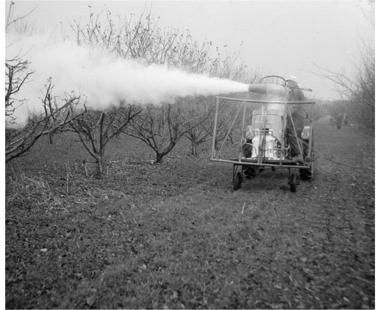
Besprutning med fläktspruta i lågstammiga fruktträd. Drottninghögs fruktodlingar, Helsingborg, 1950. Foto: Lindberg Foto. Helsingborgs Museer. Public Domain.

efter hand lämnades att växa fritt och i den mån de finns kvar har de ofta övergått till att bli kronträd. Särskilt har detta hänt när trädgårdar bytt ägare.