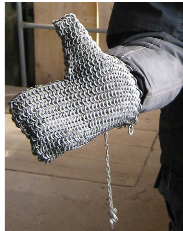
Handske för barkvård, Ericsbergs slott, Sörmland.

Att använda barkvårdande metoder kan vara ett intressant inslag i en historisk trädgårdsmiljö. Träden får ett delvis annorlunda utseende med ljusare, slätare bark. Tillammans med öppna trädrundlar och en regelbunden men varsam beskärning ger man besökaren ett tydligt intryck av en aktiv men samtidigt lite ålderdomlig fruktodling. Med rätt teknik innebär inte borstningen några risker för trädet. Man ska inte gå loss på trädet med stålborste utan använda ett snällare verktyg. En rotborste eller en lång remsa av en dörrmatta av polyeten (typ AstroTurf) kan läggas runt grenen och dras fram och tillbaka. Man gör detta allra bäst en fuktig dag när mossor och lavar sitter löst, gärna under senhösten eller under en mild vårvinter.