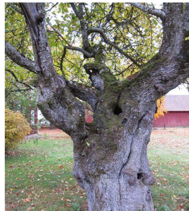
Håligheter, rötter, gamla brottytor och mossbevuxna grenar förstärker trädets ålderdomliga utseende. Alla åtgärder bör syfta till att bevara trädet så länge det är möjligt. Mycket varsam successiv gallring och avlastning av kronan fördelat på flera år, är en lämplig insats. Både vårvinter- och sensommarbeskärning kan vara aktuell.