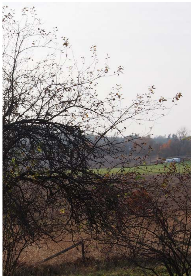
Obeskuret träd, lager av äldre fruktved bildar en "kjal" i kronans nedre del.

Genom att gallra i äldre fruktvedspartier i kronans nedre del förnyngas den delen av trädet på ett varsamt sätt. Om vi samtidigt reducerar och gallrar varsamt i kronans övre del får vi på sikt ett träd som är lättskött och som inte bildar en massa vattenskott. Beskränkning kan göras både under vårvinter och under sommar – sensommar.