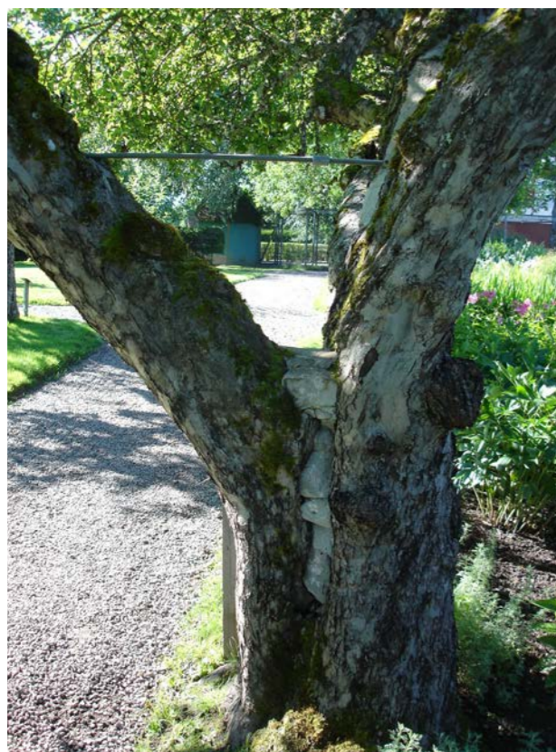
Äppelträd med betongplombering och järnstag.

I mitten av 1900-talet gjorde motorsågen sitt intåg. Det innebar en avgörande förändring i synen på vad man kunde göra med ett fruktträd. Motorsågen gjorde det inte bara lättare att röja bort gamla fruktträd, det blev också lockande att försöka minska de kvarvarande trädens storlek genom att kapa grova huvudgrenar och toppkapa huvudstammar. Resultatet av de drastiska ingreppen blev skogar av vattenskott, vilka sedan utvecklades till täta kvastlika kronor. Med de stora snittytorna frilades kärnveden vilket banade väg för kraftiga rötter genom hela trädet. Efter några årtionden kapades kanske trädet in hårt ännu en gång eller lämnades att kollapsa under vikten av den nu alldeles för täta, vida kronan.