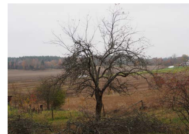
En första beskärning görs med fokus på gallring av äldre hängande fruktvedspartier och utrensning av torra och skadade grenar. En varsam reducering av kronans höjd och bredd har också påbörjats. Arbetet har till stor del gjorts med handsåg från stege, något "finlir" med sekatören är inte aktuellt i det här läget. Reduceringsarbetet vid förgreningar så att grenverket får ett mjukt och naturligt avslut. Omfattningen av gallringen ska inte vara större än att man undviker vattenskottsbildning. Beskärning under sommaren minskar ytterligare risken för att man drar i gång en allt för stark tillväxt. Det går då också att beskära lite hårdare än under vårvintern. Sänkning av kronans höjd och justering av bredden fortsätter under ytterligare ett par år. Trädet kan sedan skötas relativt enkelt med vanlig underhållsbeskärning vartannat till vart tredje år.

Den täta kronan gör också att bladverket är fuktigt långa perioder - en säker grogrund för skorv angrepp. Äppelskorv är en svampsjukdom som ger fruktskalen fula fläckar och som vid starka angrepp även kan angripa själva grenverket, s.k. grenskorv. Skorvmottaglighet är starkt sortberoende - till exempel 'Signe Tillisch' är känd för sin skorvkänslighet.