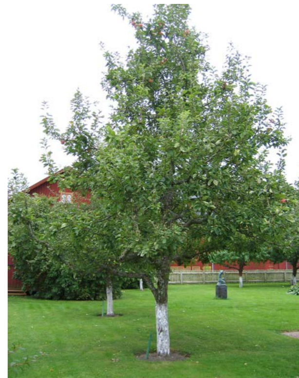
Kalkad stam, friluftsmuseet Gamla Linköping.