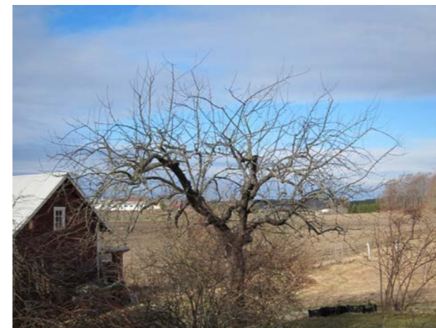
De tidigare vattenskotten har nu gallrats under två år, samtidigt har kvarvarande skott kortats in vid lämpliga, mer vågräta sidoskott. Dessa rörs vanligen inte om de inte är starkväxande, då kan en in-kortning över en välriktad knopp vara nödvändig för att sidoskott ska utvecklas även på skottets nedre del. Den fortsatta skötseln består i att ytterligare sänka allt för långa skott och att bygga ut nya grenar och fruktved på kala partier, samt att ta bort korsande grenar. Kronans alla delar är i fortsättningen väl belysta. Observera att det som på bilden liknar en mittstam är en huvudgren riktad mot fotografen.