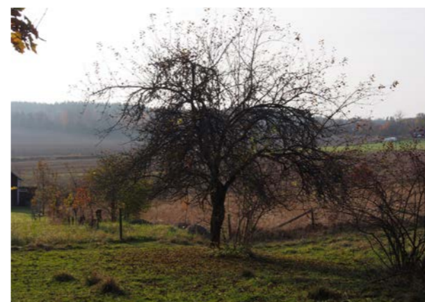
Det här trädet beskars regelbundet fram till ca 30 år innan bilden togs, därefter har ingen beskärning skett. I kronans nedre del dominerar tjocka lager av äldre, hängande fruktgrenar. All egentlig tillväxt har skett i kronans övre del. På grund av beskuggningen producerar trädet mestadels små och dåligt utvecklade frukter, endast i den övre delen finns förutsättningar för att fin frukt ska bildas.