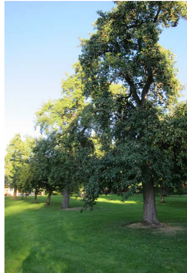
Rader av gamla, höga fruktträd i herrgårdsträdgård, Östergötland.

medverkat till att förkorta livet på träden. I vår tid är också viltrycket betydande. Det är lätt att förbise att både rådjur och älg under det tidiga 1900-talet var i det närmaste utrotade från delar av landet.