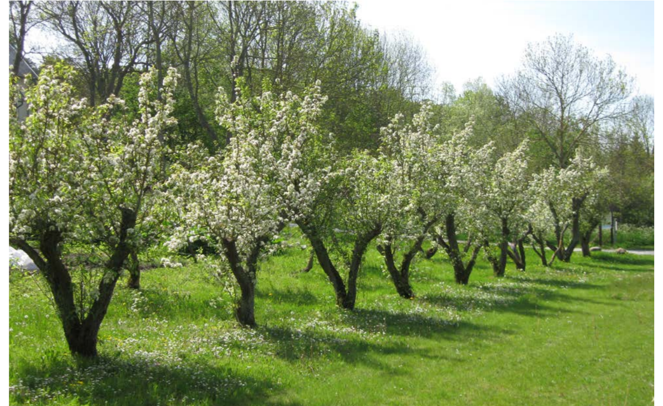
Gamla plummonträd i korgform. Lummelunda, Gotland.

När vi tittar in i en äldre, större fruktträdgård kan det vara svårt att se att det en gång varit just en sådan välskött och produktiv fruktodling. Under åren som gått har träden ändrat karaktär och blivit gamla och knotiga, ibland också rejält höga. Kanske finns där också gamla vindbrott och fläkningar. Dessutom har marken under träden övergått från att en gång ha varit en öppen, harvad yta till att bli en tät gräsvall.