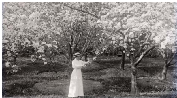
Även i en extensiv fruktodling var man noga med att hålla marken kring träden öppen. Fruktodling i Bohuslän 1920.

För att öppna upp en trädrundel är ofta en grävgrepp det bästa redskapet. Med en vanlig tvårädsträdgårdsspade skär man först rundelns ytterradie och sedan skär man "tårtbitar" från trädstammen och utåt. Man skär igenom grässvålen men undviker att skada grova rötter.