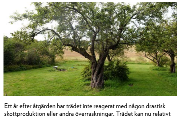
Ett år efter åtgärden har trädet inte reagerat med någon drastisk skottproduktion eller andra överraskningar. Trädet kan nu relativt enkelt skötas med fortsatt varsam gallring och reducering med något eller några års mellanrum. Kronstabiliseringen kontrolleras regelbundet med några års mellanrum och justeras vid behov.