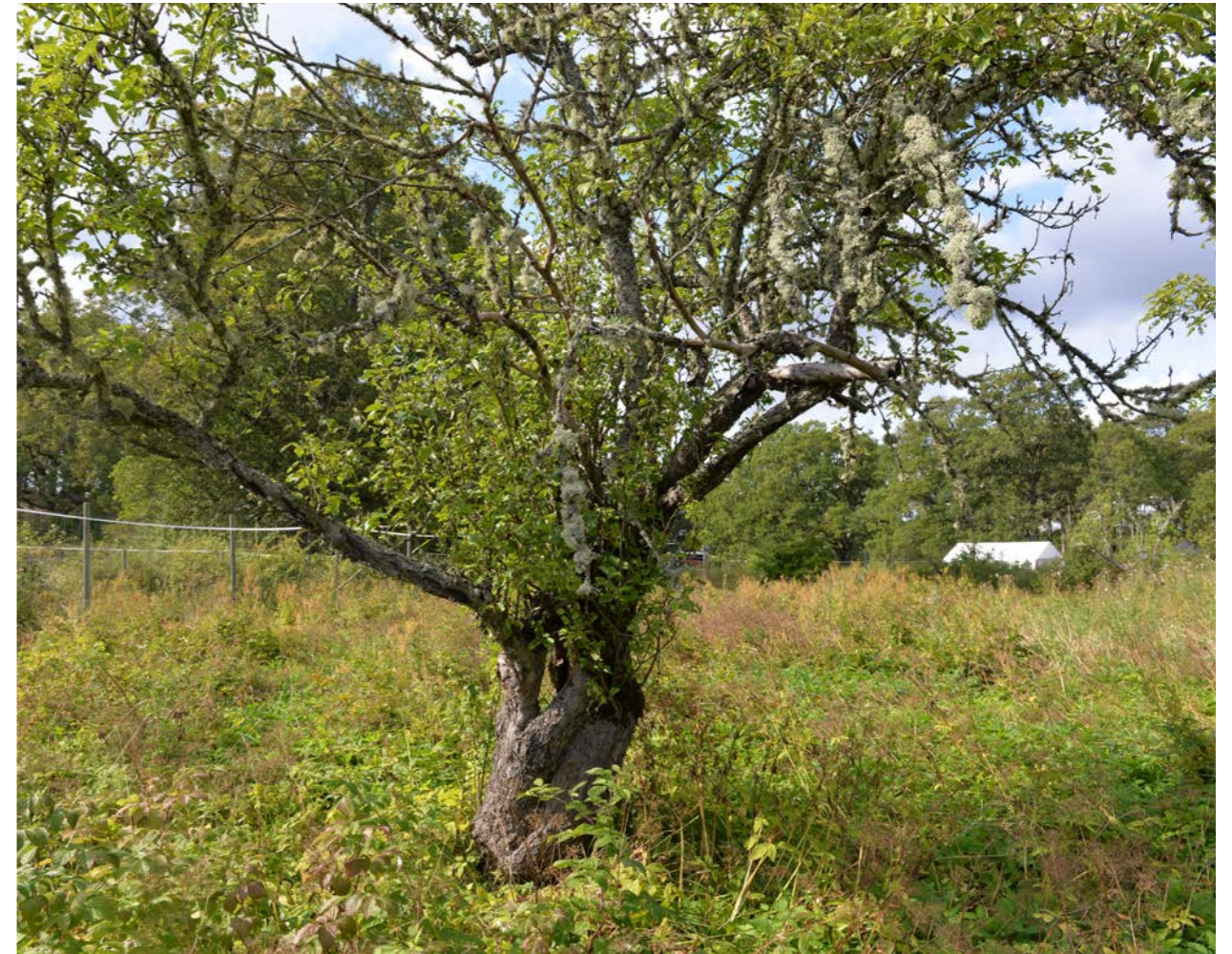
Ett åldrande träd där kronan börjat torka in. Stammen är mycket instabil på grund av kraftig röta och det är stor risk för kommande grenbrott och fläkningar. Trädet är i slutfasen av sin levnad.