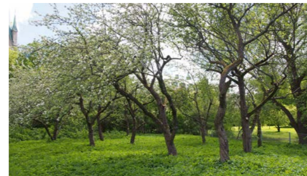
Det är inte helt lätt att föreställa sig att det här en gång var en del av en liten välskött produktionsfruktodling med lågstammiga träd...