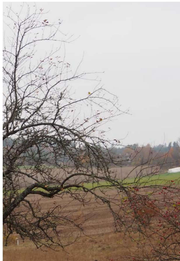
Fruktvedspartier gallrade och långa grenar reducerade vid sidoskott.