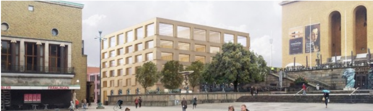
Fig. 3. Tham & Videgårds förslag till Nya konst i Göteborg.