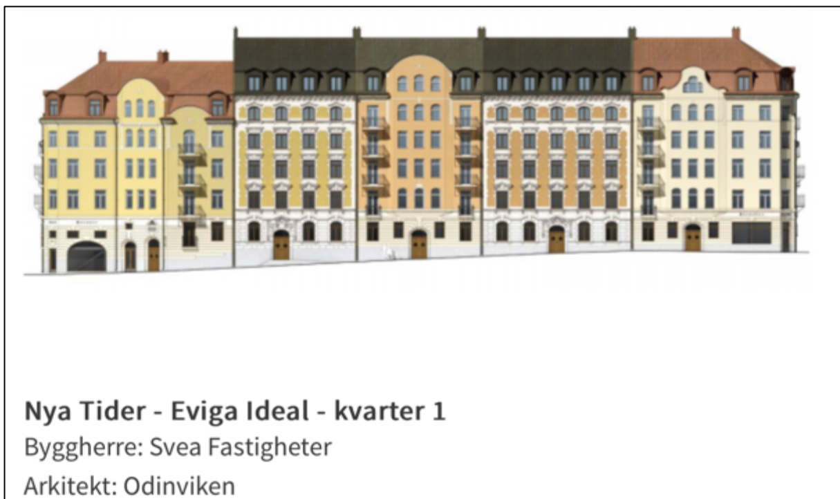
Fig. 1. Ett av de vinnande bidragen ur tävlingen från Upplands Väsby kommun. (Faksimil av illustration. Upplands Väsby Kommun . Hämtad 28 maj 2023).

Upplands Väsby stadsarkitekt Lena Nordenlöw har varit med i processen att välja ut de olika bidragen i omröstningen. Hon anser att de äldre stilarna kan fungera som inspiration, men att den nya bebyggelsen måste anpassas till platsen och omgivningen som den byggs på.