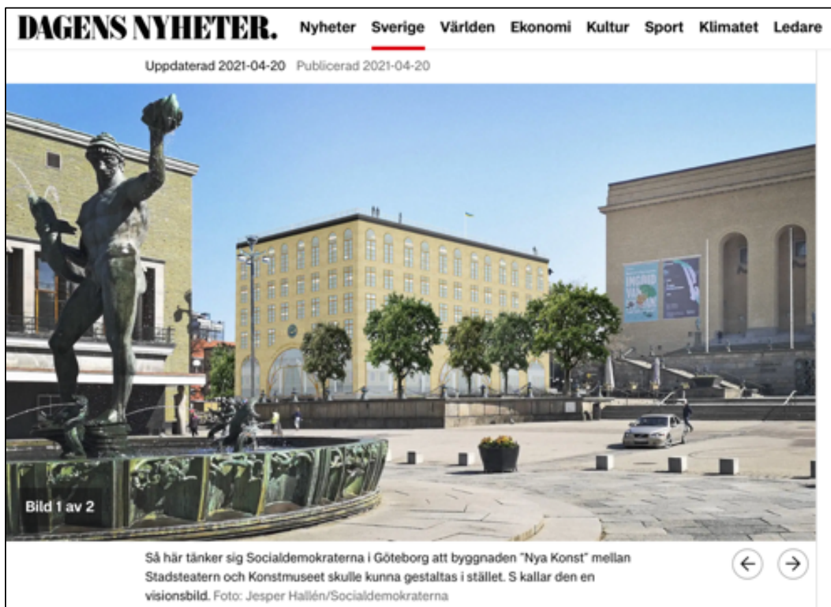
Fig. 4 . Socialdemokraternas förslag till Nya Konst i Göteborg. (Faksimil av visionsbild. Dagens Nyheter ; Jesper Hallén/Socialdemokraterna. Hämtad 25 juli 2023).