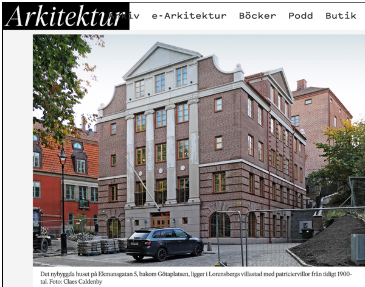
Fig. 6. Byggnaden som uppförts i 1920-tals klassicistisk stil på Ekmansgatan 5 (Faksimil av fotografi. Arkitekten ; Caldenby, C. Hämtad 25 juli 2023).

moderna byggnadsstandarden som är präglad av ekonomiska nedskärningar snarare än att byggnaden är fel i idén, han förklarar: ”Det är klassicism ’enligt boken’, men dessvärre också svenskt bygge enligt boken. De två trivs inte tillsammans, lika lite som modernismen trivs med samtida svenskt bygge.” Caldenby framhåller att det finns god och sämre klassicism, men att det i slutändan alltid är kvaliteten på byggnaden som avgör om den är god eller inte, oavsett stil. Caldenby ser inte att det är möjligt att bygga god arkitektur i klassisk stil idag, främst för att byggnadskvaliteten är så präglad av ekonomiska faktorer.