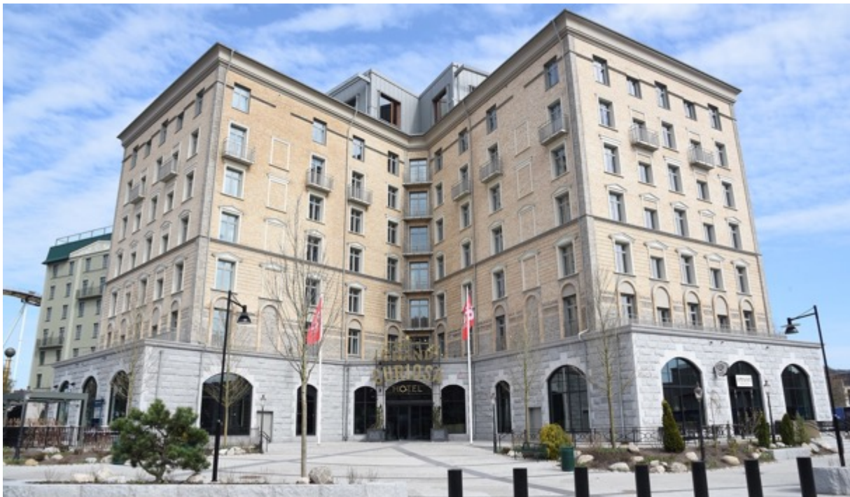
Fig. 5. Nya Hotell Grand Curiosa i Göteborg. (Fotografi. Wikimedia ; Mattias Blomgren, CC BY-SA 4.0. 16 april 2023).

Hulter menar att allmänheten vill ha bebyggelse i klassisk stil och att byggnaden på Ekmansgatan 5 är ett bra exempel på hur bebyggelse kan gestaltas klassiskt. Samhället har enligt Hulter för stor respekt för arkitektskrået. Siesjö anser att som politiker lägga sig i hur arkitektur ska gestaltas är totalitärt beteende.