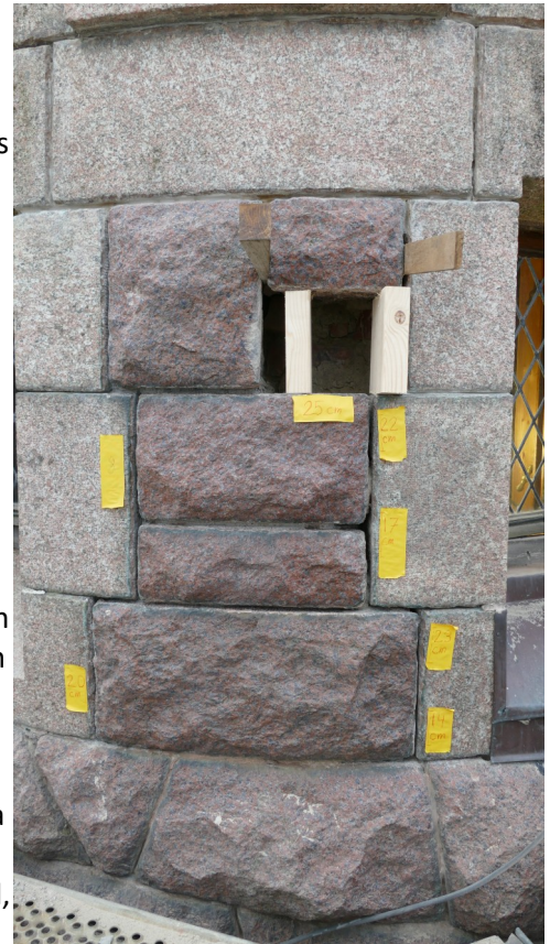
Figur 6: Restaurering av fasad på slottet

Röjning och naturvårdsarbeten fortsätter enligt skogsbruksplanen som arbetades fram år 1988. Förslag på en ny väg tas fram redan år 1973, och den planeras byggas år 1995 men kommer inte i bruk förrän flera år senare. Idag går vägen inte längre via grindstugan, istället går den strax öster om Storstugan och kyrkan, och målet är att minska biltrafiken på området. Byn genomgår mellan år 1999-2013 successiva restaureringar och renoveringar, och ett av de större projekten de senaste fem åren är återuppbyggandet av "Esters hus" i arbetarbyn, som projekterades redan år 2017. Under år 2018 startade bygget och år 2021 stod stugan färdigbyggd enligt Wahlmans ritningar. Det är i nuläget den enda stugan i byn som har halmtak, något som byggdes från början men som redan under 1920-talet började bytas ut mot takkåpor. Tjänsteflygeln som byggdes om under 1960-talet har sedan år 2020 varit under restaurering och arbetet är fortfarande igång år 2023. Projektet har innefattat exteriör och interiör reparation och restaurering på grund av fuktskador orsakade av 1960-talets renovering, och återställande till den tidigare planlösningen.