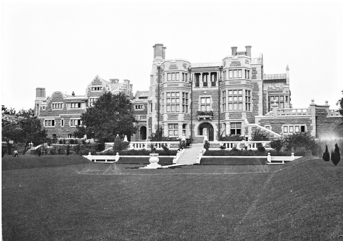
Figur 4: "Sjösidan" av Tjolöholms slott (1906), Carolina Mathilda Ranch

De första åren efter att familjen köpt egendomen lades nästan all fokus på stuteriet och kör- och ridskolan, men eftersom det blev allt tydligare att ett nytt bygge skulle behöva ersätta den gamla huvudbyggnaden påskyndades planeringen allt mer. Efter herr Dicksons död tillskrevs Wahlman att designa ett mausoleum, vilket han valde att rita i klassiskt grekisk stil (Svalin Gunnarsson, 2021). En del av Wahlmans uppdrag var att även rita statarnas stugor i den så kallade allmogebyn, och han ritade även grindstugan och Folkets Hus, hembygdslokalen där man bland annat hade skola åt barnen och den stora julfesten varje år (numera kallad Storstugan). Stugorna utfördes av sju röda enplanshus med vita knutar och halmtak, enligt typisk allmogestil eller hemtrevnadsstil, och Folkets Hus var av samma typ men betydligt större då den skulle kunna användas som samlingslokal för arbetarna (Stiftelsen Tjolöholm, 2014).