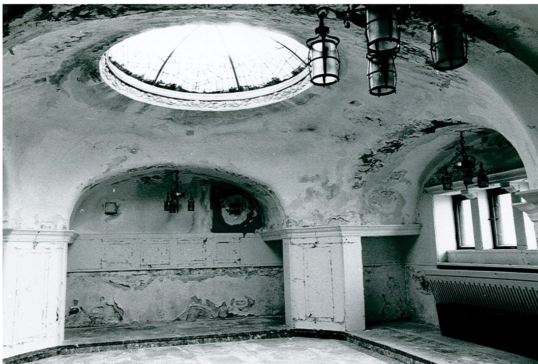
Figur 5: Biljardrummet, ca 1960-tal

På slottet börjar restaureringsarbeten år 1968 i de rum som planeras visas upp för allmänheten, samt arbeten på slottets tak och fasad. I många av områdets byggnader, inklusive slottet, finns fuktskador som behöver åtgärdas och nästan alla skorstenar är i behov av reparation. I de pärmar som i arkivet har benämningen "Tjolöholm etapp IV" och "Tjolöholm etapp V" från år 1969, hittas uppgifter om vad som skett under det samt det föregående året. Man gör en omfattande restaurering av nästan alla vägg- och takmålningar, och frilägger den övermålad marmorn på väggarna i biljardrummet, som under en period använts som vinterträdgård. Textilier och tapeter som enligt bedömning blivit förskadade byts ut. Framförallt handlar det om heltäckningsmattor och tapeter, men även vissa möbler kläs om och gardiner byts ut. Tapeterna som byts ut är i vissa fall, som i salongen, noga utvalda och tillverkade av samma firma som gjort originalet. Reparationer av VVS-anläggning och förnyelse av elinstallationen, samt förnyelse av fönster och omläggning av entrégolv är andra saker som sker. Den fem meter höga tavlan Drottningen av Saba tas även ned och rengörs.