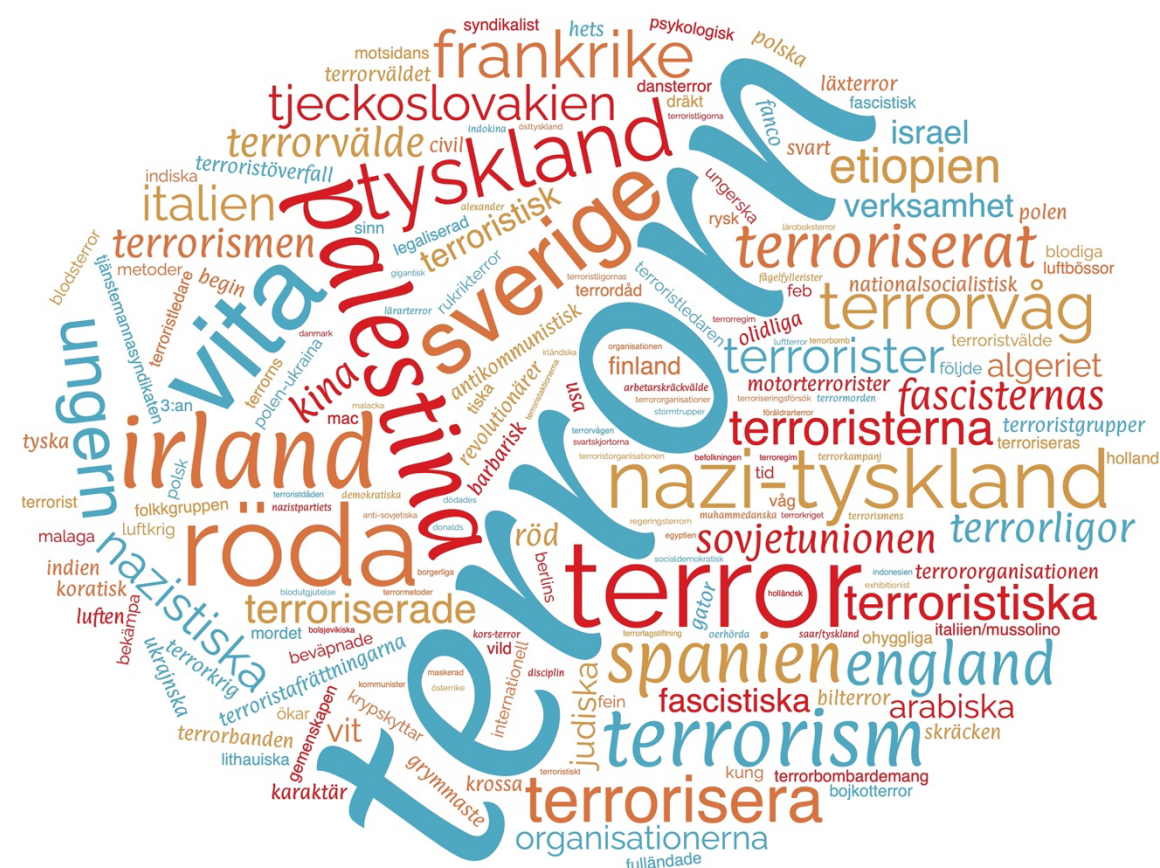
Figur 2. Sammanställning av de mest förekommande orden 1920–1960 i ett så kallat Word Cloud, där storleken på texten visar frekvensen av begreppen. I denna bild är också länder som nämns inkluderade.

I nedanstående bild kan en illustration ses av bruket av begreppet så som författaren fångat det i det digitala verktyget Wordcloud. 169