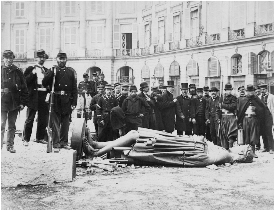
Bild 2. Pariskommunen 1871. Kommunarder på Place Vendôme vid den omkullvräta Napoleon I statyn.

Källa: Nationalencyklopedin, Pariskommunen. 95