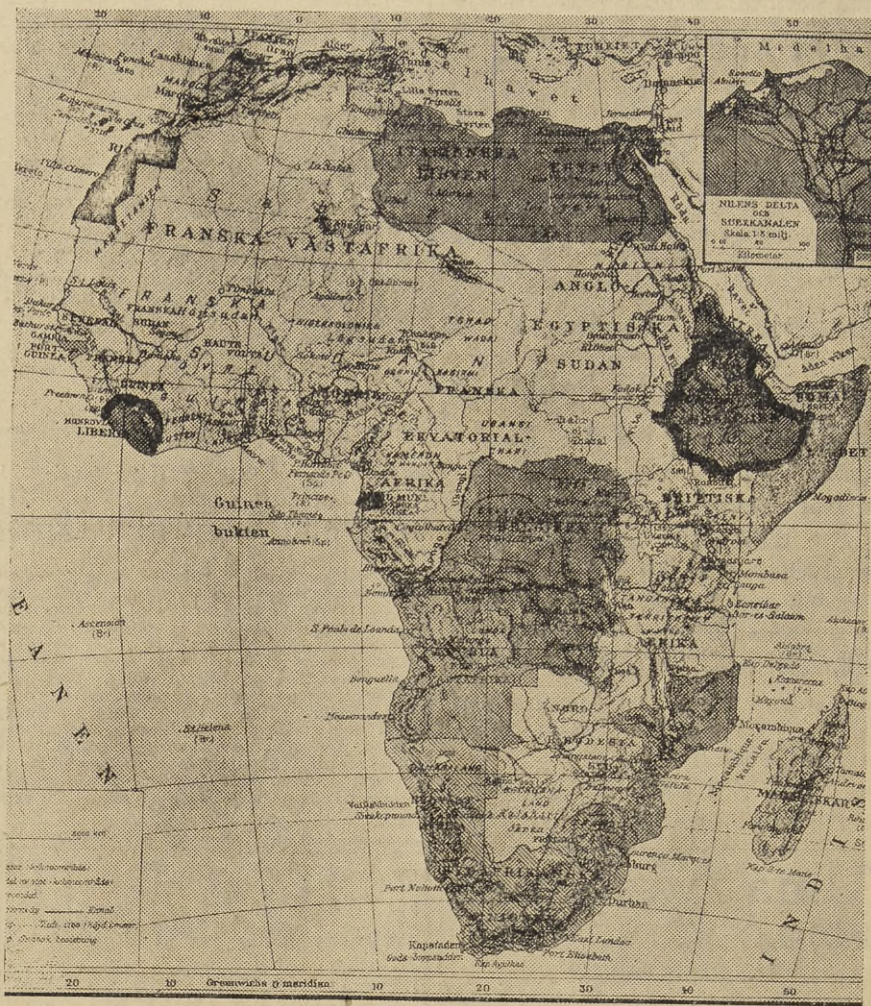
De svarta områdena, Abessinien och Liberia, äro de enda oberoende länderna av hela afrikanska kontinenten.

Den politiska kartan över Afrika visar bilden av en av främmande makter helt beroende världsdelen. Av hela det väldiga området på 29 miljoner kvadratkilometer är det bara två små fläckar som göra skäl för namnet oberoende länder, nämligen det omstridda Abessinien i öster och den lilla negerrepubliken Liberia på västra kusten. Utom en del av Saharaöknen, som praktiskt taget saknar ägare, står för övrigt hela den afrikanska kontinenten i form av kolonier, skyddsområden eller mandatländer under olika europeiska makters kommando. Icke mindre än 53 miljoner av Afrikas invånare lyda sålunda under Storbritannien. Därtill kommer Egypten med sina 10 miljoner, som ehuru till namnet självständigt faktiskt lyder under England. Frankrike råder över 35½ miljoner människor, Portugal över nära 9 miljoner, Italien över knappt 2, Spanien över 1½ och Belgien över 11 miljoner.