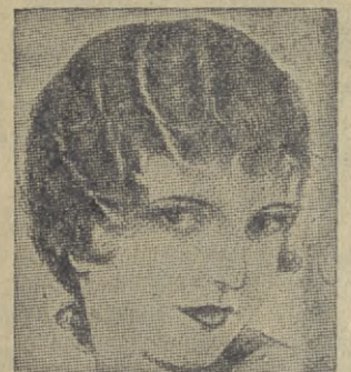
Permanent. 15 kr.