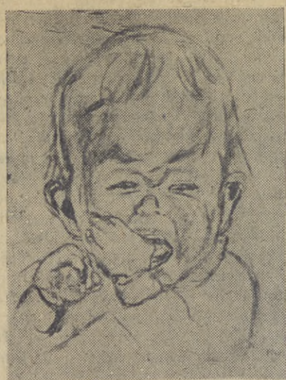
Siri Derkert: Barnstudie.

Om där hade varit starkare gallring, färre saker, mera teckningar och akvarel-