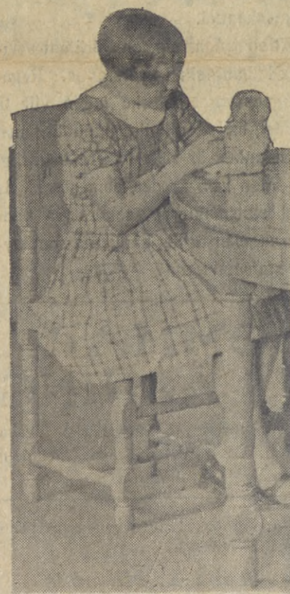
I lekrummet på Tempelbacken.

Föräldrar och lärare måste helt enkelt som nationerna sätta sig ner och tänka över hur de skola klara sig, sedan de nu måste avrusta. Och liksom vissa problem-