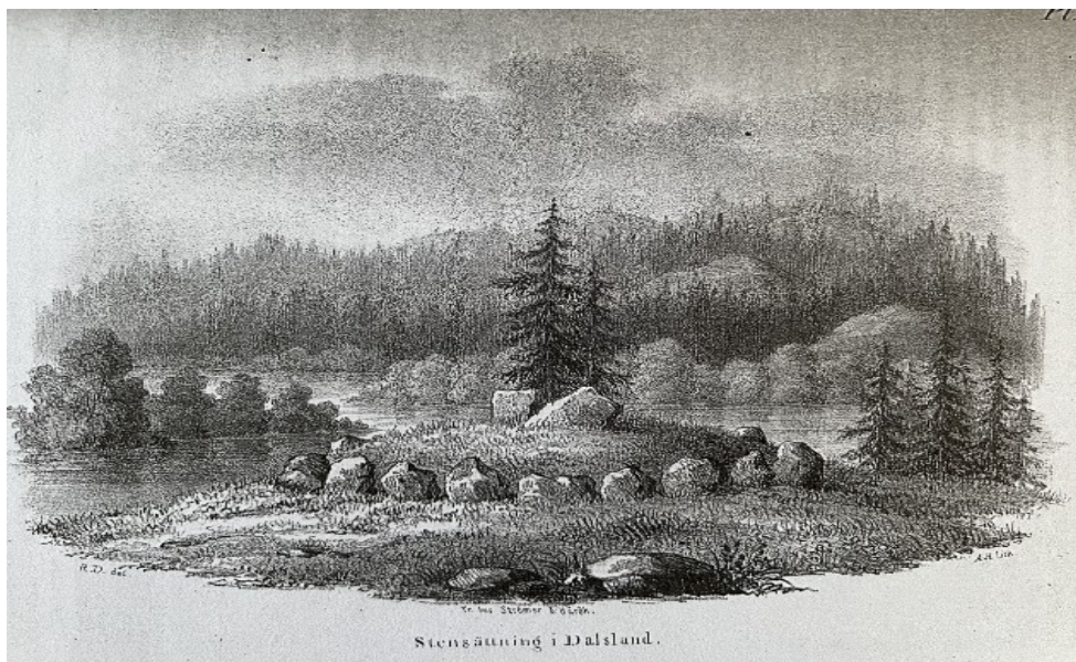
Bild 2. Stensättning i Dalsland.

Pl 1 (mellan s 12-13). Majhäftet 1844. Runa Antiqvarisk tidskrift.