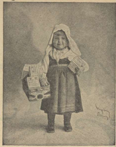
Min mamma använder alltid Mustads margarin.

vilka rådde överproduktion. Angä- ende lanthushållningsskolorna upp- lystes att därav finnas 30 i vårt land samt att årligen utexamineras 25 lä- rarinnor.