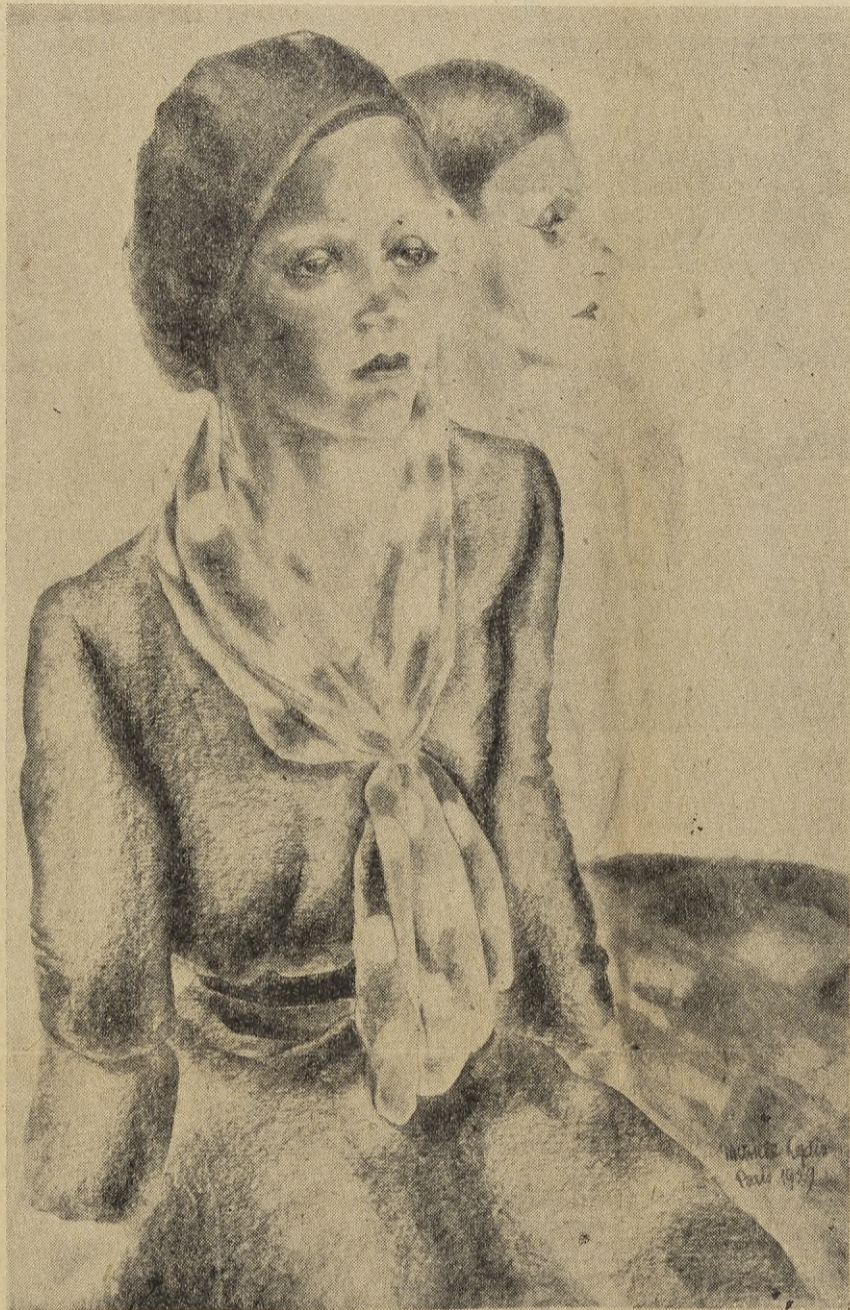
Ungdom. Efter en målning av den ryktbara unga wienskan Mariette Lydis.

Här visar sig alltså i dessa grupper av olika livsföring den överhandtagande sexualiseringen av livsintressena