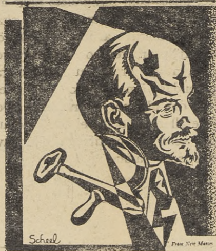
LENIN. Träsnitt ur Den Nya Massan

de djupa bondemassorna skola acceptera eller förkasta kommunismen som en religion, som duger att offra och lida för. Kan istället förföljelserna mot präster och gammaltroende väcka en religiös frimodighet inför lidandet, som går upp emot eller övergår den ryska kommunismens, då kan man av historiens upprepade vittnesbörd nästan sluta, att med dessa förföljelser sås ett säde till reaktion, som på ont och gott kan bli kommunismens överman.