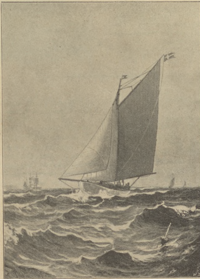
»Tyr» »för fulla muggar»

Programmet för festen — stilfullt och stilrent såsom man kan vänta från Wald. Zachrissons officin — var mycket lofvande. Festens ändamål: att genom blifvande öfverskottet bidra