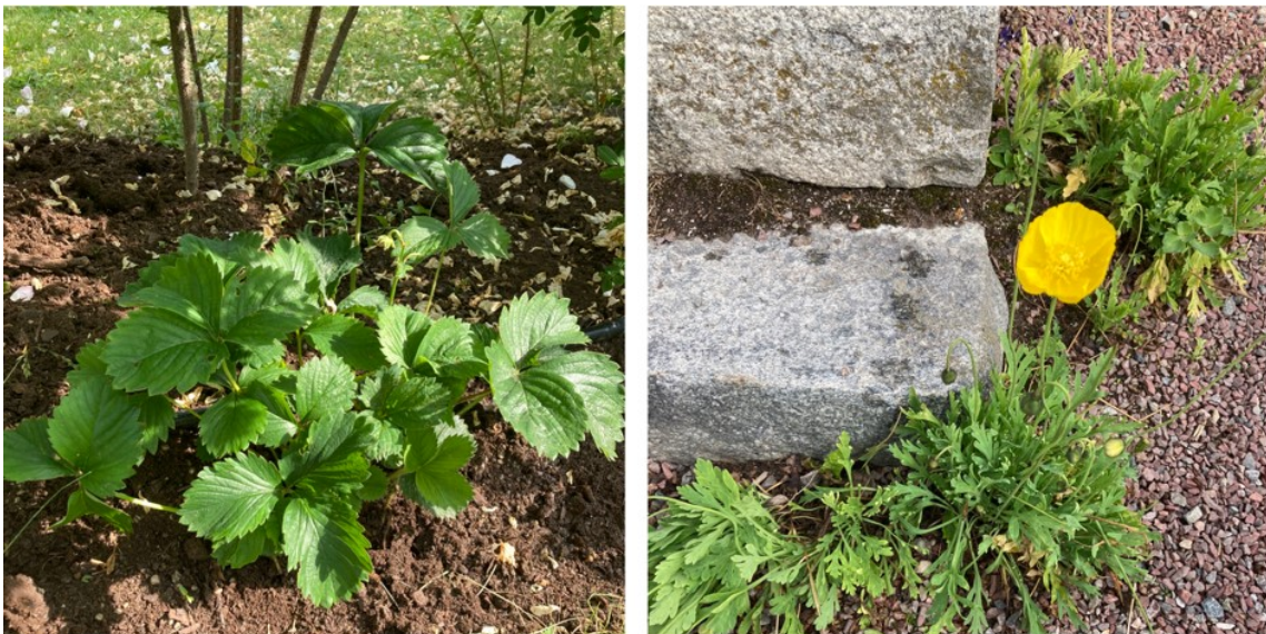
Figur 9. Jordgubbsplanta och liten vallmo i köksväxtlandet.