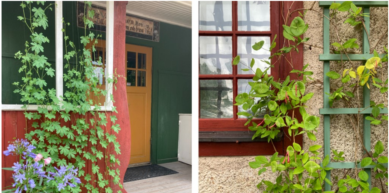
Figur 8. Fjärilskrasse vid huvudentrén och spaljé med kaprifol.