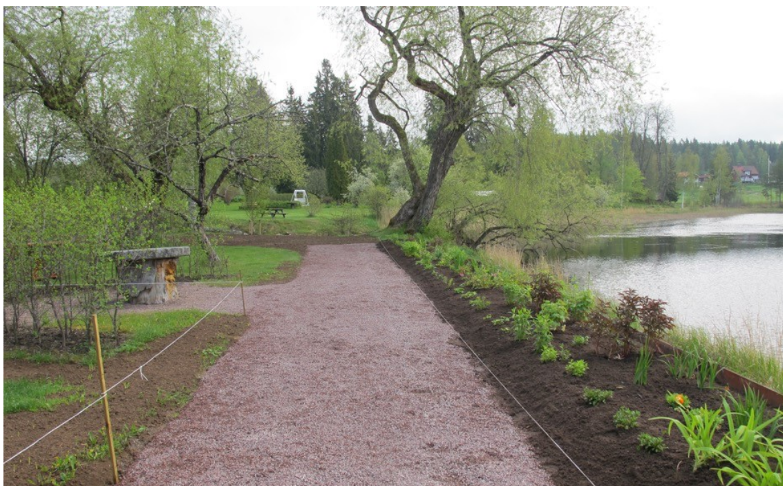
Figur 6. Sjölandet under pågående rekonstruktion.