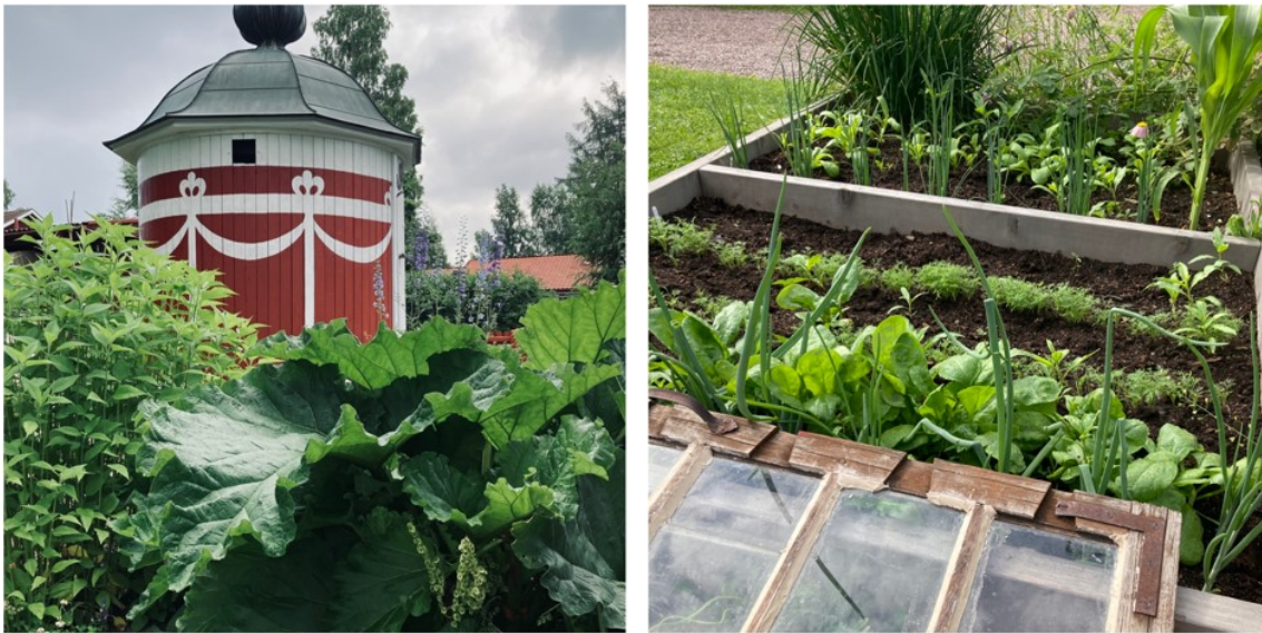
Figur 7. Köksväxtlandet med det cylinderformade pumphuset. Foto: Julie von Hofsten 2022.

Skötselplanen innehåller instruktioner som utgår från de olika kategorier av växtmaterial som finns i trädgården. Växterna kategoriseras på följande sätt i skötselplanen: "Klippt gräs", "Perenner/lökar/annueller samt kryddväxter", "Rosor och buskar i rabattytor", "Klippt häck", "Klätterväxter", "Park - och prydnadsträd" samt "Grusytor". Köksväxtlandet beskrivs inte i skötselplanen. En möjlig orsak är att växtmaterialet som beskrivs under kategorin "Perenner/lökar/annueller samt kryddväxter" kan innefatta även det som var tänkt att planteras i köksväxtlandet. Det kan också vara så att man inte hade beslutat kring köksväxtlandets funktioner. Som tidigare nämnts var detta en ny yta som aktiverades i den privata delen av trädgården (se figur 7).