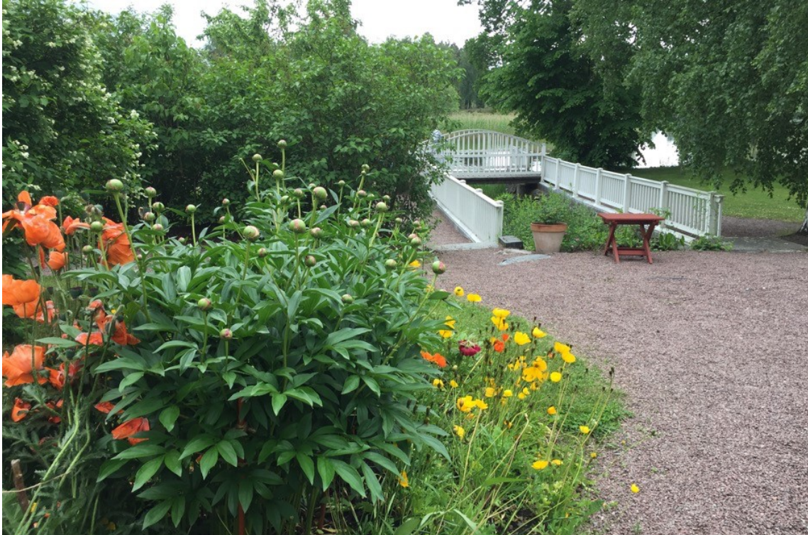
Figur 5. Plantering återskapad efter målning av Carl Larsson.