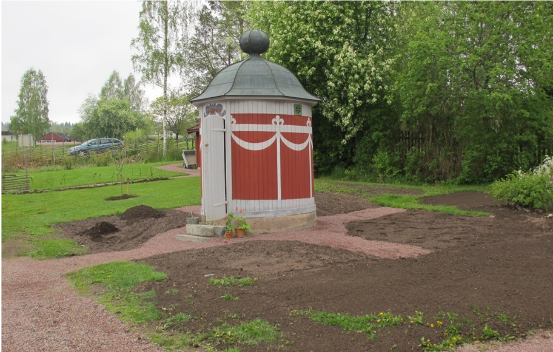
Figur 4. K kstr dg rden under p g ende rekonstruktion.

Efter  tg rdsf rslaget f ljer bilagor med foton p  rabatterna under juni, juli och augusti 2010 samt bilaga med j mf relse mellan m lningar, foton och nuvarande f rh llanden. Enligt inneh llsf rteckningen ska det  ven ha funnits en v xtlista som bilaga, men denna saknas i den version av f rstudien jag haft tillg ng till.