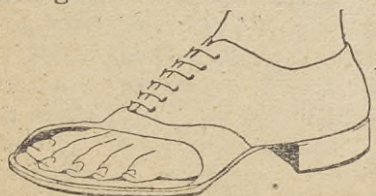
Så ledigt skall tårna ligga i skon.