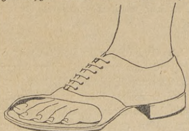
Så lediga skall tårna ligga i skon.

Promenadskor och Kängor samt finare inneskodon av bredare och smalare typ, med låga klackar eller best. utan klackar, utarbetade av Sv. Kv. Centr. Förb. för Fys. Kultur och tillverkade av Eslov's Sko- fabriks Akt.-Bol. finns och kan beställas i Anna Ahlströms MANUFAKTUR o. KORTVARUAFÄR Gätgatan 95 - Stockholm - Tel. Sö. 311 84