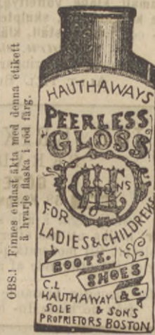
OBS! Finnes endast å kta med denna etikett å hvarje flaska i rood färg.