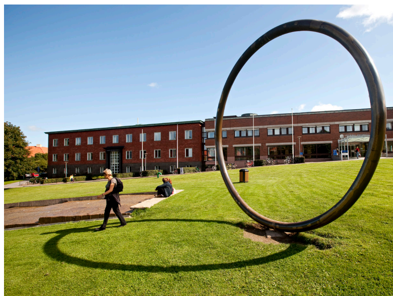
I Humanistiska biblioteket huserar KvinnSam.