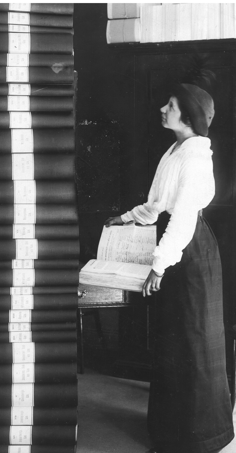
Namninsamling för kvinnlig rösträtt, Elin Wägner, 1913.