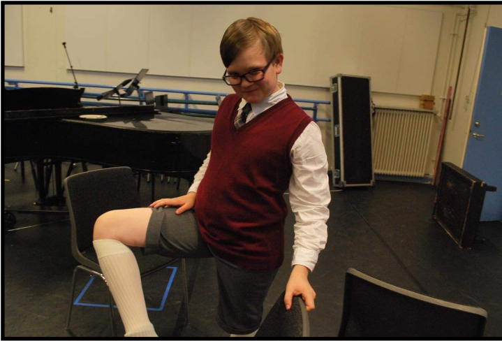
Foto: Här är jag 11år och är iklädd kostymen för operan Carmen som operan satte upp.

På högstadiet gick jag musikklasser, under gymnasiet var jag jazznörd, sedan följde ett år på folkhögskola med inriktning musikteater. När jag sedan kom in på musikalutbildningen vid Högskolan för scen och musik vid Göteborgs Universitet (2019) kändes det att cirkeln var sluten och jag äntligen var tillbaka hemma på scenen igen.