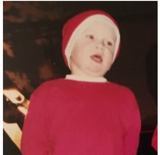
Foto: Jag 4år i tomtedress på Konserthuset

När jag fyllt nio år frågade min pappa mig en morgon om jag kunde Idas sommarvisa . Jag svarade honom att den kunde jag inte, så då bad min pappa bad mig att välja ut en låt som jag kunde utantill. Det blev vaggvisan Tula hem och Tula vall och med den visan satte vi oss i bilen och körde ner mot Malmöoperan och audition till barnkören där. I sex år var jag verksam i Malmö operas barnkör och jobbade som barnsolist på operan. Jag var med i produktioner som Carmen , Parsifal , Trollflöjten med flera. Min kärlek för scenen var fullständig och jag visste att det var här jag ville vara.