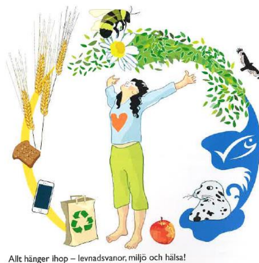
Figur 4. Illustration från lärobok 5 (Hjalmarsson & Sjöholm, 2021, s. 6)

Den för lärobok 5 unika kategorin ”hälsa som helhet” stämmer mycket väl överens med kursplanens syntetiska syn på hållbara levnadsvanor. Stoffet som kategoriserats under kostplanering är inriktat på att varje person kan, och bör, hitta sitt eget sätt att leva mer hälsosamt. Såväl boken som kursplanen visar alltså en tydlig ambition att erbjuda information kring olika val man kan göra, snarare än att hävda att en strategi eller en livsstil passar för alla.