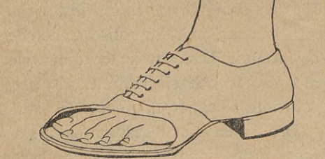
Så lediga skall lärna ligga i skon.

Götgatan 95 - Stockholm - Tel. Sö. 311 84