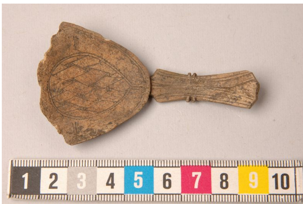
Fig 3. Samisk sked, Arjeplog. 2008.

Denna rapport skriven av Riksantikvarieämbetet kring Farokonventionen förankrades genom en särskilt tillsatt referensgrupp. I denna referensgrupp ingick även en extern forskare vars syfte var att utreda konventionen som instrument för den offentliga kulturmiljöförvaltningen. Riksantikvarieämbetet tillfrågade inte representanter från Sametinget att vara en del av den nämnda referensgruppen (Sametinget 2015:2). Detta trots att kulturarvets värde i högsta grad är en aktuell samisk fråga, där Sametingets syfte som statlig institution är att ge samerna ett inflytande i de frågor vilka berör den samiska kulturen (Sametinget 2015:3). Således pågick utredningen kring konventionen fullständigt utan insyn på samernas ställning som urfolk i Sverige.