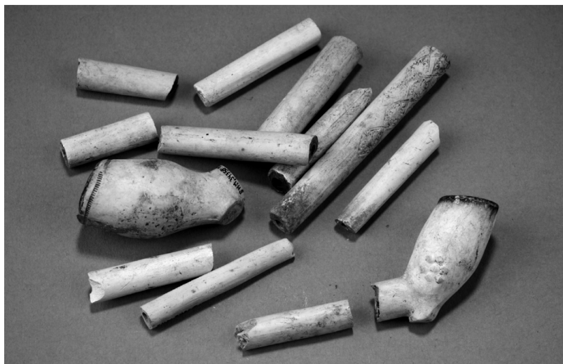
Fig 4. Lerpipor, material kategoriserat som icke-samiskt på SHM.