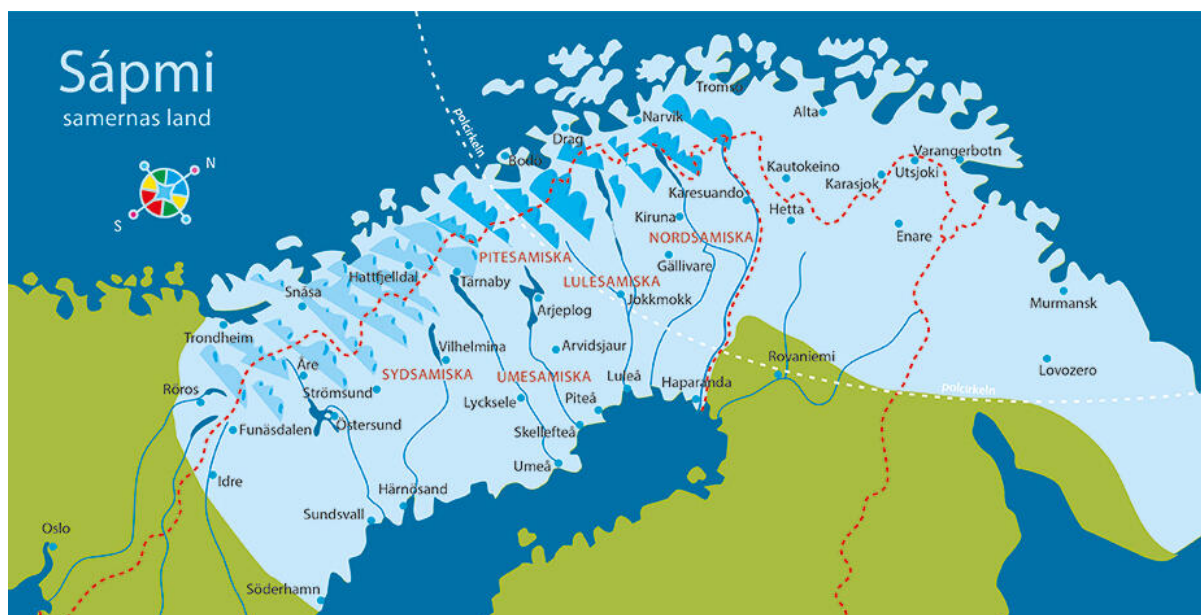
Fig 5. Karta över Sápmi, illustrerad av Anders Suneson för Nordiska Museet.

I länder som Storbritannien, Belgien, Nederländerna och Frankrike lever det koloniala arvet tydligt kvar i form av formella koloniala egendomar (Mulk 2009:199). Dessa egendomar är något som Sverige saknar och således gör att Sverige till synes skiljer sig från de andra nämnda länderna. Till följd av detta har Sverige kunnat måla upp sig självt som ett progressivt land, där undervisning om den svenska kolonialismen och Sápmi tycks vara överflödigt (Stutz via Eng 2020:30). Det aktiva och öppna diskriminerings praktiserandet har övergetts, men ännu behålls den centraliserade hegemonin på ett mer återhållsamt sätt (Mulk 2009:195). Det koloniala arvet inom Sverige visar i dag upp sig i form av attityder och upprätthålls i och med museala utställningar (Mulk 2009:199).