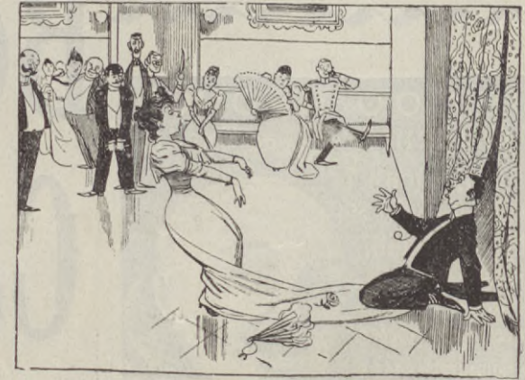
Hon: Nå kors, hvad är väl detta här! Han: Men stanna då... jag er besvär... En balgäst: Af »glatta laget» gick det där!

D. J. Bonniers Boktryckeri Aktiebolag TIDINGS- och VERKTRYCK