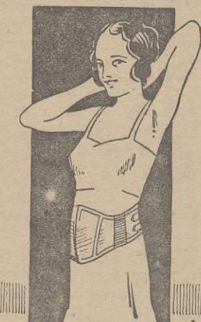
Illustration of a woman in a corset, likely demonstrating a bandage or garment.

Kirurgiska Instrument Fabriks A.-B. KIFA Regeringsgat. 31. Tel.: N. 286