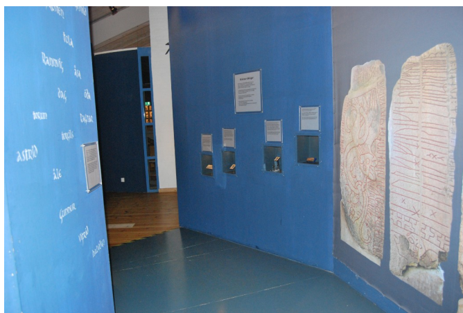
Figur 20 Interiörbild för det sista rummet i "Mellan Is och Eld" 17/2 2022

Nu kommer besökaren in i utställningens sista rum med ett blått tema, och det första som möter besökaren är en vägg med bilder på olika runstenar och en text som berättar om Sparlösa stenen och dess runor och bilder. På andra väggen står en mängd olika forntida namn och en text som berättar om de olika namn som går att läsa på runstenarna. Besökaren bemöts också i rummet av en textskylt med titeln "Kristna vikingar" som handlar om hur människorna mötte kristendomen redan på 900-talet och att områdets spår efter vikingatiden är annorlunda jämfört med andra delar av Sverige. Sedan finns det ett antal montrar med föremål och en tillhörande text som berättar om dem, och den första montern är en amulett av röd täljsten och texten berättar om hur den hittades och om dess utseende. I andra montern finns några krucifix med figurer på och texten berättar om hur de hittades och hur det kom till museet. Den tredje montern har en metallnyckel, och texten berättar om hur kvinnan fick nyckeln som ett bevis för hennes status och ansvar för hushållet. Ännu en monter innehåller en spetsig pryl i metall som enligt tillhörande text tolkats på olika sätt, bland annat som en pekare som användes för att följa textraderna i en mässbok. Till sist bemöts besökaren av en plansch med målade figurer och frågor om makt, status, och demokrati. (ovanstående stycken är baserat på författarens observationer och besök på utställningen 17/2 2022)