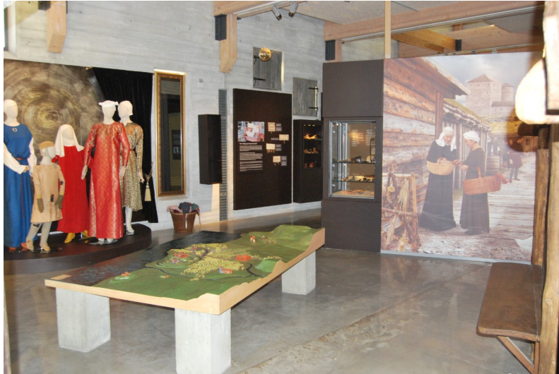
Figur 8 Interiörbild för tredje rummet i "Medeltida Liv" 25/1 2022

I rum nummer tre fortsätter temat staden, men med mer fokus på vardagslivet, färgtemat i rummet är brunt och svart. Det första som besökaren möter är ännu en text med medeltida still på skriften och ett rim som handlar om livet i staden. På väggen intill ingången hänger en textskylt som handlar om hur Lödöse utvecklades från ett fåtal gårdar på 1000-talet till en stad med 1500-2000 invånare på 1300-talet, och dess tillbakagång på 1400-1500-talen då befolkningen uppmanades flytta till Nya Lödöse istället. På ena sidan av en liten trästuga hänger en text som handlar om hur staden Lödöse växte fram ur handelsmännens behov av en strategisk träffpunkt istället för på kungens order som de flesta andra städer gjorde, och hur handeln blomstrade och staden växte. När besökaren går in i den lilla stugan möts man av ett antal träbänkar och en monter med en modell av en del av Lödöse, och trycker besökaren på en knapp får man höra en berättelse om en så kallad vanlig dag i staden, och olika vardagliga händelse. En bit utanför stugan finns en modell över hela staden Lödöse i miniatyr och en bit av landskapet runtomkring runt år 1300. I rummet finns även en dator där besökaren kan klicka sig fram och läsa om stadens historia, olika byggnader i staden så som Sankt Peders kyrka eller Sankt Olovs kyrka. Även det medeltida stadslivet, och hygien och skönhet på medeltiden går det att läsa om på datorskärmen.