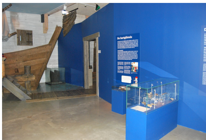
Figur 6 Interiörbild för första rummet i "Medeltida Liv" 25/1 2022

I första rummet av utställningen möts besökaren av en textskylt med en text och bild i medeltida stil, som med rim välkomnar en till staden. Dessutom möts besökaren av en stor upphängd bild som föreställer en glasmålning av målade människor i medeltida kläder. Rummet har fått blåa väggar och många av textskyltarna är även de blåa, längst in i rummet har en modell av en del av ett stort träskepp byggt upp vid en träbrygga som leder in i andra rummet i utställningen. En tolkning skulle kunna vara att detta första rum ska ses som hamnen vid Lödöse. I rummet finns även två skärmar som spelar upp en film med ett antal olika utklädda karaktärer som välkomnar besökarna till staden och kort pratar om sitt liv. Även ett antal anställda på museet välkomnar besökaren, bland annat museichefen, en arkeolog, och en pedagog. Karaktärerna är bland annat en manlig spansk frigiven träl, drottning Blanka, kvinnan Tala Priswalk, vikingen Kol, med flera. Runtom skärmarna har en stor modell med jordlager, där markytan för olika århundraden är markerat, med 1986 års markyta längst upp och 1000-talet längst ner.