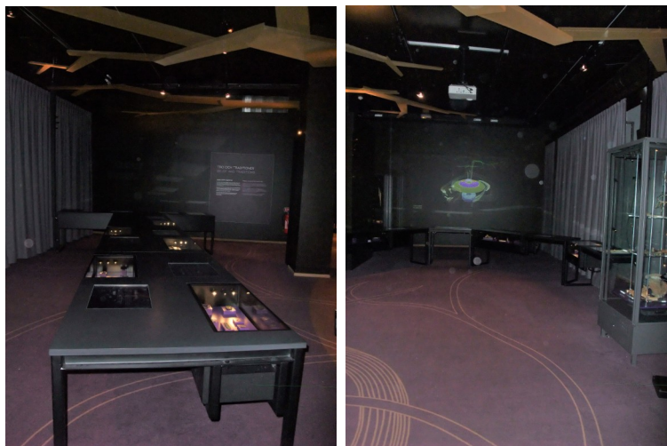
Figur 25 & 26 Interiörbilder för Tro och Traditioner i ”Vikingarnas Värld” Fotograf: Pernilla Swanson 3/3 2022

Därefter hamnar besökaren vid en monter full med flera olika amuletringar, flera runbleck, olika sorters hängen, och en fingerring. Här handlar tillhörande text om hur arkeologiska fynd kan berätta om tron i vardagen, besvärjelser, föremål som representerade gudar, och om olika källor som berättar om den fornnordiska tron. Nästa monter innehåller flera amulethängen, och andra hängen med figurer och symboler, och tillhörande text berättar om de olika vikingatida myter, gudar/gudinnor, och hur amuletterna ofta liknar föremål som hör samman med dessa. Bredvid finns en monter med hängen, en helgonbild, en spjutspets, och en enkolpium. Tillsammans med montern finns en text som handlar om att folk både handlade med och dyrkade relikier i kristendomen även i Skandinavien. Därefter bemöts besökaren av en stor monter full med olika mynt, flera armband, hacksilver, tenar, en syl, en nit, flera bitar av bränt ben, och många keramikkrävar. Denna monterns text handlar om hur gränser och övergångar både i byggnader och i naturen blev naturliga