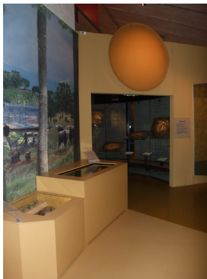
Figur 14 & 15 Interiörbilder för andra rummet i ”Mellan Is och Eld” 17/2 2022