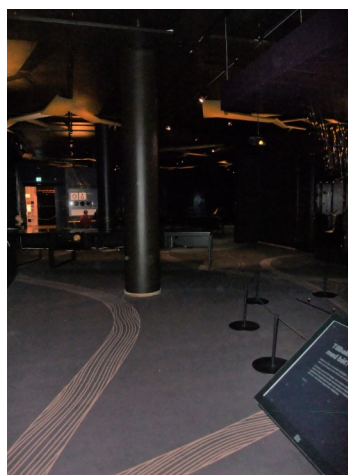
Figur 27 & 28 Interiörbilder för Levande och Döda i "Vikingarnas Värld" Fotograf: Pernilla Swanson 3/3 2022

Nästa tema i utställningen kallas för "Levande och Döda" och en stor text med den rubriken berättar om föreställningar om livet efter detta, fornnordiska gravskicket, och det kristna gravskicket. I denna del av utställningen finns en stor bild sten med lampor och en projektor riktade mot den för att lysa upp dess bilder. Framför stenen finns även en monter med flera armringar, en halsring, en hornplatta, och två olika formade spännen. Tillhörande text berättar om bildstenen och vad dess bilder föreställer. Texten fokuserar även på ringar som maktsymboler och att guldskeer ofta bestod av ringar, vilket ger en koppling till montern intill med sådana ringar. Sedan bemöts besökaren av en monter med en ring med flera torshammarhängen, fragment av en kam, flera pärlor, ett gravbröd, några broddar, och brända ben i en gravurna. Texten intill montern handlar om hur brandgravarna såg ut, om deras innehåll, och om begravningsplatserna som användes länge. Texten fokuserar även på de fornnordiska sagornas berättelser om att kontakta de döda, och liknande. Bredvid finns ännu