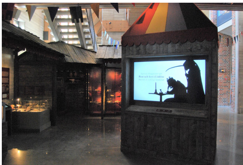
Figur 7 Interiörbild för rummet "Staden" i "Medeltida Liv" Fotograf: Pernilla Swanson 25/1 2022

Andra rummet i utställningen kallas för staden, och har röd som färgtema. Besökaren möts av ett antal träkonstruktioner eller hus/marknadsstånd med olika montrar och texter. Vid ingången till andra rummet kan besökaren läsa ännu en text i medeltida stuk, med en bild och rim i texten med temat staden. Bredvid ingången finns också en liten monter med en läderpung, en trästicka med runinskrift, och en skälkniv med runinskrift. I mitten av rummet står en träkonstruktion med en skärm, där besökaren kan titta på tre olika berättelser från "Narrens Skuggteater". De tre berättelserna är Kungens pestbrev, Den bakvända visan, och Munkarnas slagsmål. Till vänster i utställningen med ryggen till ingången finns en text som handlar om att medeltidens syn på äktenskap och kärlek var annorlunda, här nämns också hur unga flickor i rika familjer giftes bort, exempelvis norska prinsessan Ingeborg.