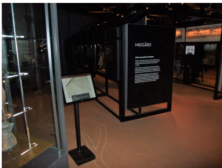
Figur 24 Interiörbild för Midgård i "Vikingarnas Värld" Fotograf: Pernilla Swanson 3/3 2022

posamentknutar, nålar, sisare, sax, en glättsten, glättbräde, nystbricka, en vävkam, och vävbrickor. Monterns text berättar om vävning och textilhantverket, hur det gick till, och de föremål som användes. Bredvid denna monter och text finns en station där besökaren kan se hur de vävda band kunde ha sett ut när de var nya, känna på sådana kopior, få information hur de användes, känna på ull, dra ut lådor och läsa om hur brickvävning av band gick till, vad för olika material som användes, och hur färgning av tygerna gick till. Sedan kommer nästa monter full med olika kammar, nålar, spelbrickor, ringar, bitar av horn, städ, en ask, ett städ, selbågskrön, och en sälja. Tillhörande text berättar om hur föremål skapades av horn och djurben. Bredvid bemöts besökaren av den sista texten och montern, som handlar om silversmide och bronsgjutning, hur föremålen smyckades med djurornamentik, och att hantverket var omgärdat av olika ritualer. I tillhörande monter kan besökaren se bland annat drakhuvuden i metall, en spjutspets, ett svärd, gjutformar, spännen, flera barrar, en matris, och flera deglar. Intill montern finns en 3D-kopia av en gjutform som besökaren kan läsa om i blindskrift och vanlig text.