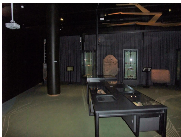
Figur 22 Interiörbild för Släkt och Hierarki i "Vikingarnas Värld" 3/3 2022

Besökaren bemöts sedan av en runsten med inristade runor och bilder innan nästa monter dyker upp med bland annat textilfragment, ett svärd, guldtråd, fragment från en vikbörs, olika mynt, ett mynthänge, olika vikter, pärlor, spelpjäser, olika formade spännen, en glasbägare, en bjällra, ett brickvävt band, spegelglas, söljor, ett nålhus, ett kors, ett torshammarhänge, två remändebeslag, en sköldbuckla, delar av hästbetsel, ringar, delar av utrustningen till en draghäst, sax, kniv, borrh, yxa, bryne, rasp, kil, hängbryne, hammare, eldslagningsflinta, eldstål, och olika järnprylar. Texten intill berättar om möten och utbytet av tjänster, varor, och idéer som skedde under vikingatiden, och om en grav som var full av olika föremål som påverkats av olika områden och stilar i världen både lokalt och från fjärran platser. I monterns text kan besökaren också läsa om runstenen bredvid montern. Bredvid nästa monter finns ännu en runsten som besökaren kan läsa om i monterns text. I montern finns bland annat hängkärl, en tatingerkanna, en nyckel, flera dräktspännen, en trattbägare, flera halsband, en kam, en amuletring, pärlspridare, en glättsten, och glättbräde. Tillhörande text handlar om föremålen som hittats i kvinnors gravar som speglar de aristokratiska och förmögna kvinnornas komplexa roller.