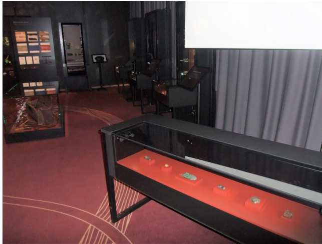
Figur 23 Interiörbild för Gudomligt Hantverk i "Vikingarnas Värld" Fotograf: Pernilla Swanson 3/3 2022

vardagsredskap och rättigheter som fria män. Den sista montern i denna del av utställningen innehåller spännen, ett nålhus, kedjor, en krok, och pärlor. Texten intill berättar med fokus på kvinnorna hur rikedom och makt visades upp genom dekoration på dräkterna. Intill finns även en 3D-kopia av ett ovalspänne som besökaren kan känna på och en text både vanlig och i blindskrift som berättar om spännet.