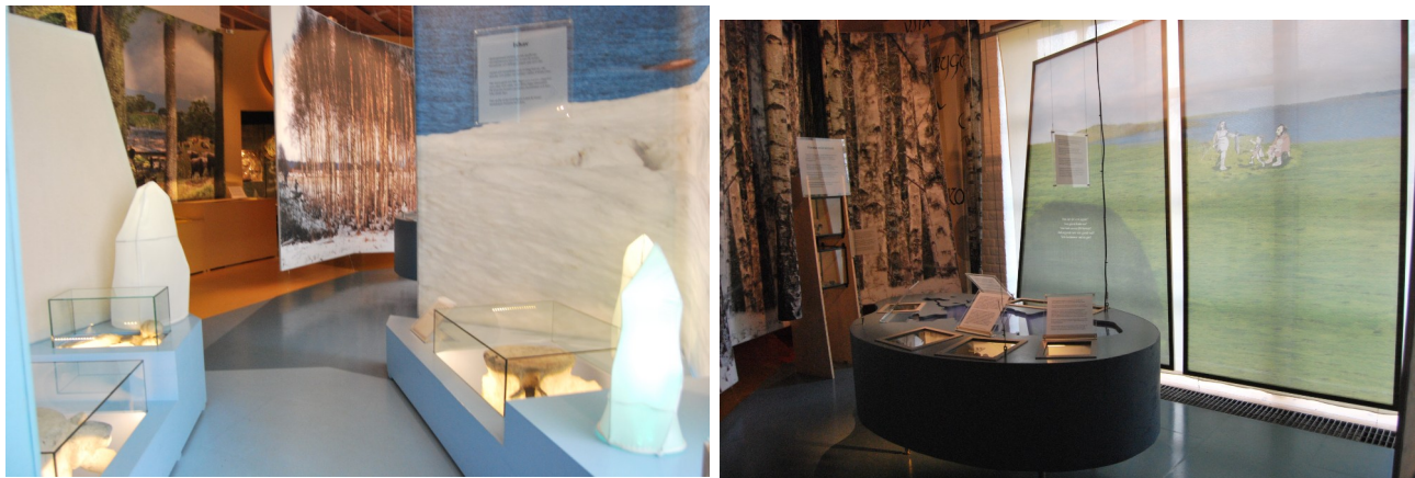
Figur 12 & 13 Interiörbilder för första rummet i "Mellan Is och Eld" 17/2 2022

Det blåa temat fortsätter in i en liten hörna med några planscher med ett målat landskap och en familj där en kvinna jagar och en man sitter med ett barn i knät. På planschen ställs frågor om vem som jagade, vem som skapade kläderna, vem som tog hand om barnen, och vad som avgjorde vem som gjorde vad. I mitten av denna lilla hörna finns ett ovalt blått bord med montrar och texter i och konturerna av en sjö, ovanför hänger en text som berättar hur det funnits förutsättningar för ett gott liv vid Hornborgasjöns stränder ända sedan inlandsisen försvann och att de första människorna dök upp här för 10 000 år sedan. Texten berättar även om hur grupperna som höll till där flyttade runt säsongvis utifrån hur tillgångarna till mat och råvaror varierade. I en monter på bordet finns flera olika flintbitar och olika flintverktyg, och texten ovanför beskriver hur olika redskap har använts för tillverkning av föremål i trä, ben, och horn. Texten bredvid beskriver hur försörjning skedde genom fiske och jakt, och vanliga fynd runt Hornborgasjön är pilspetsar och olika yxor. I två tillhörande