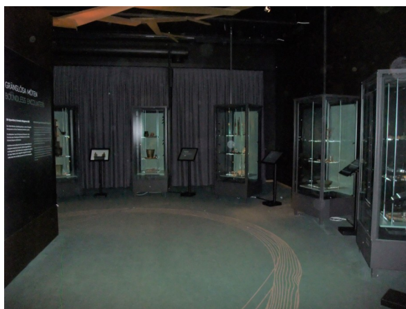
Figur 21 Interiörbild för Gränslösa Möten i ”Vikingarnas Värld” 3/3 2022