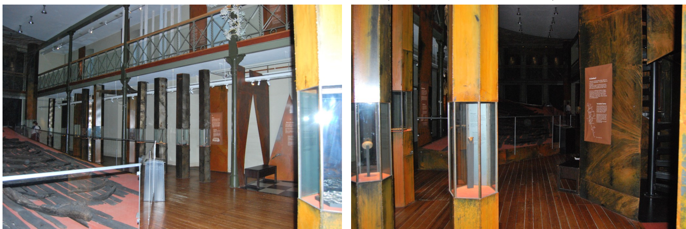
Figur 1 & 2: Interiörbilder för våning 1 i "Vikingr" Fotograf: Pernilla Swanson 21/1 2022

På Göteborgs Stadsmuseum har en utställning om vikingatiden valts ut att analyseras. För att komma till utställningen går man upp för ett par trappor till höger om receptionen. Efter ett par trappor kan man antingen fortsätta upp eller vika av och gå in i Vikingr (Göteborgs Stadsmuseum u.å.) till höger. Utställningen Vikingr öppnades på Göteborgs Stadsmuseum i mars 1995 och handlar om vikingatiden. Utställningen öppnades samma år som en annan utställning (1995-1996) om vikingar på Eriksbergshallen i en samproduktion (Databasen Carlotta u.å. c). Utställningen fokuserar på vikingarnas historia och vardagsliv med Äskekärsskeppet som utgångspunkt, som hittades 1933 av en bonde som diktade ut vid Göta Älv (Databasen Carlotta u.å. c).