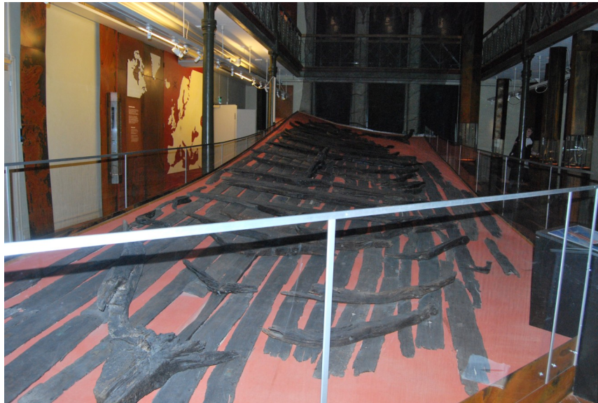
Figur 3: Åskekærsskeppet i utställningen "Vikingr" 21/1 2022

En bit ifrån ingången är en spiraltrappa placerad som leder upp till övervåningen, och hängandes bredvid denna trappa är en skylt, "Gränslandet", som välkomnar besökaren till utställningen. Texten förklarar att utställningens föremål kommer från Danmark, Norge, och Sverige, och det är Åskekærsskeppet som är i centrum av utställningen. Om man går igenom utställningen genom att gå åt vänster och runt möter man först en monter med ett dekorerat svärdhandtag, med en förklarande text om det manliga ansiktet på föremålet. I montern bredvid möter man en besmanvikt där hedniskt och kristet möts i de ristade runorna och runbokstäverna på föremålet. Den tredje montern innehåller en silverskatt med mynt från många olika håll, ett kristet kors, och sönderklippta silversmycken. Tillhörande text förklarar att byteshandel var det vanligaste, men man betalade även i vägt silver. Ännu en silverskatt som hittats vid Lid visas upp i en monter bredvid, texten förklarar att ordet lid syftade för på livvakter som följde med hövdingar och kungar på resor. Sedan har besökaren kommit fram till Åskekærsskeppet, där det bland annat finns en skylt som berättar om Vidfamne som är en tolkning och rekonstruktion av Åskekærsskeppet. Ännu en textskylt vid skeppet berättar om hur skeppet upptäcktes på 1930-talet i Göta älvs lera och att skeppet troligtvis var en knarr som på 900-talet e.Kr. seglade som handelsfartyg.