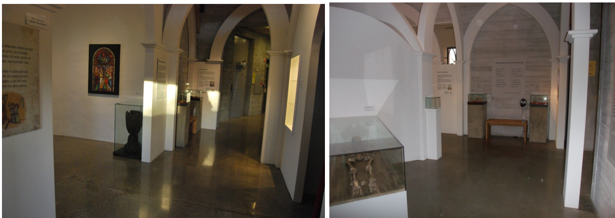
Figur 9 & 10 Interiörbilder för rummet "kyrkan och döden" i "Medeltida Liv" Fotograf: Pernilla Swanson 25/1 2022

finns ännu en monter som innehåller en ljusstake i brons, en dörringhållare i brons, och en försilvrad primklocka. På den vänstra väggen hänger en textskylt som bland annat handlar om hur medeltidens människor bekände sina synder för en präst som kunde ge syndaförlåtelse, hur kyrkan påverkade livet, och hur vissa delar av en gudstjänst gick till.