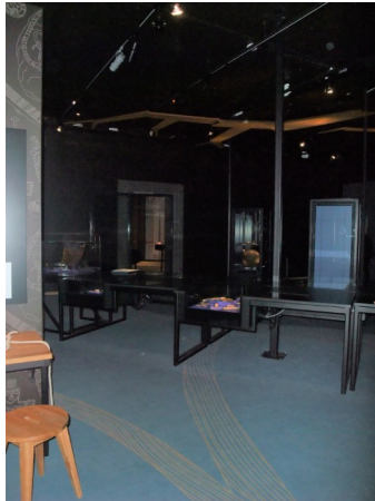
Figur 29 Interiörbild för Vattenvägar i "Vikingarnas Värld" Fotograf: Pernilla Swanson 3/3 2022

finns en monter med ett båtspant, och en tillhörande text som berättar om olika båt- och skeppsfynd som gjorts både i gravhögar på land och i vattnet, och texten ger ett antal olika exempel. I denna del av utställningen finns även en skärm där besökaren kan spela ett spel där de ska skapa en vikingatida båt genom att hugga träd, klippa får för seglet, och skapa rep av hästsvansar med mera. Skeppstemat fortsätter med en monter som innehåller tågvirke (rep), en nål, en klubba, en vakare, och en krok. Monterns text berättar om att många olika fynd med koppling till skepp och sjöfart har hittats och lett till rekonstruktioner av vikingatida skepp så som stora handelsskepp och långsmala krigsskepp. Bredvid finns en text som berättar att avbildningar av vikingatidens skepp finns på bildstenar, och på olika föremål så som mynt och vikter. En tillhörande monter visar upp några mynthängen, ett vanligt mynt, en skärva från ett kokkärl, och en vikt som alla har ett skepp inristat.