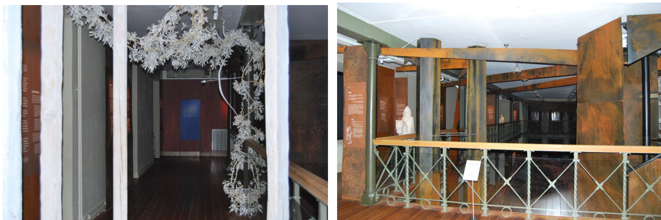
Figur 4 & 5: Interiörbilder för våning 2 i "Vikingr" Fotograf: Pernilla Swanson 21/1 2022

Genom att gå upp för spiraltrappan kommer besökaren till en övervåning med en gång som leder runt hela rummet med en öppen mitt där det går att se Äskekärrskeppet på nedervåningen. Mittemot trappan finns en utgång eller ingång på övervåningen och vid sidan om den finns det en textskylt som handlar om en runsten som kallas Sparlösa stenen, som restes på 800-talet e.Kr. och murades in i en kyrkvägg på 1800-talet. Bredvid hänger en textskylt som berättar att nordmännens visdom har samlats i båda Eddorna, som är dikter om vikingatiden nedtecknade på 1200-talet. Med ryggen mot ingången på övervåningen går besökaren sedan åt vänster, och möter då en text om Odin, en av vikingarnas gudar. Längsmed gången står en staty som troligtvis föreställer Odin och hans häst Sleipner, som nämndes i föregående text. Därefter introduceras besökaren via en textskylt till åskguden Tor och hans hammare Mjölneur. Även Tor och hans hammare får en staty. En kort text sammanfattar för besökaren att den nordiska mytologin hade två gudaskläder, asar och vaner. Här bemöts besökaren av en monter med torshammarringar och ett dosformigt spänne dekorerat med guden Tors getabocker. Tillhörande text förklarar att torshammare på ringar troligtvis spelade en viktig symbolisk roll. Sedan kommer en av de första texterna med endast citat ur texten Hávamál, just denna handlar om att man förlorar sitt minne och vett när man dricker och är onykter.