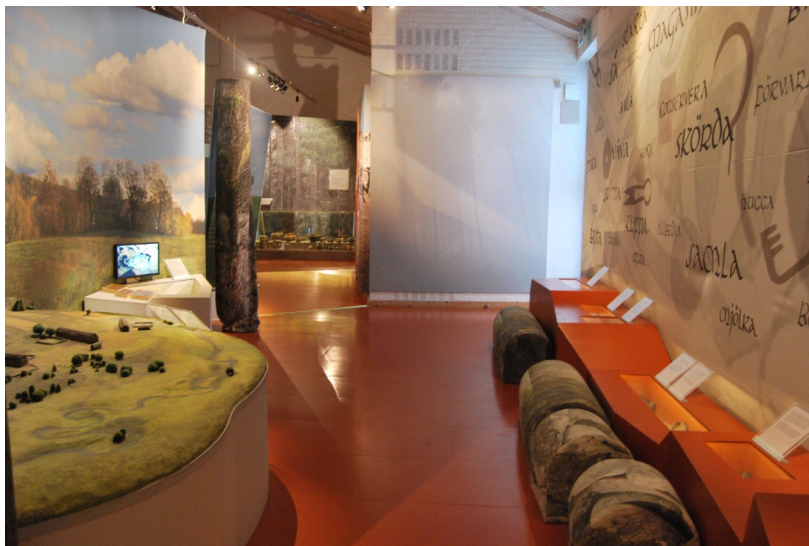
Figur 18 Interiörbild för järnåldersrummet i "Mellan Is och Eld" 17/2 2022

Vid en lite större monter med olika keramik- och lerfragment och mindre keramikkrärl finns det två texter. Den ena texten handlar om att samhället byggde på självhushåll och överflödet för vissa ökade, vilket ledde till nya behov och ett utrymme för fler specialister så som smeder. Den andra texten vid montern handlar om hur man sällan hittar hela föremål vid en utgrävning och det mesta är fragment och sådant som blev avfall och skräp, och många material bryts ner. Bredvid finns en monter med ett keramikkrärl med dekor och olika fragment. Texten intill handlar om kärlet som hittats på en boplatser i Segerstorp i Skövde, om tolkningar kring kärlet, och om att keramiken från boplatserna varierade i storlek och form. I ännu en monter finns en malsten, en skära i järn, och mindre stenar att krossa sädeskorn mot malstenen med. Tillhörande text berättar om malstenen, hur en malsten användes, och om de sädeslag som odlades under järnåldern. Bredvid en monter full av olika djurben finns en text som handlar om att mat- och slaktavfall i form av djurben hittas ofta på