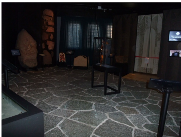
Figur 32 Interiörbild för Stadslika Platser och Kristna Monument i "Vikingarnas Värld" Fotograf: Pernilla Swanson 3/3 2022

pärlor, bärnsten, en hornplatta, hornspill, en sländtrissa, en doppsko, islägggar, gjutformar, fragment av vävtyngder, och en ringnål.