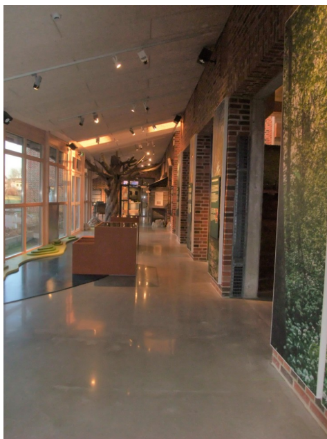
Figur 11 Interiörbild för rummet "Omlandet" i "Medeltida Liv" 25/1 2022

om hur klimatet blev kallare under 1300-talet, att digerdöden svepte in, och de svåra konsekvenser som då skedde med social oro, svält, och död. En tredje text handlar om hur människorna levde tillsammans med djuren som gick fritt på dagen och låstes in på natten. Mitt i rummet finns en stor monter som bland annat innehåller tuppben, getkranium, kranium från nötkreatur, hästskor, en skära, kratta, en träspade, och en betsedetalj. Bredvid finns ännu en monter som innehåller bland annat fiskekrokar, en ask, flera nätsänken, bindnålar, ekorr- eller fågelpilar, en slunga, en nätkavlar, och ett par nätflöten.