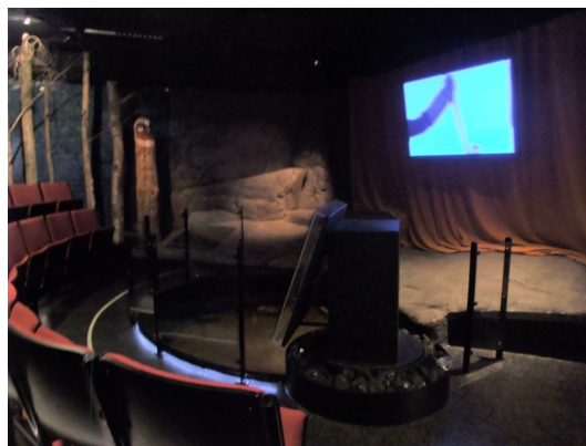
Figur 16 & 17 Interiörbilder för bronsköldrummet respektive filmrummet i "Mellan Is och Eld" Fotograf: Pernilla Swanson 17/2 2022