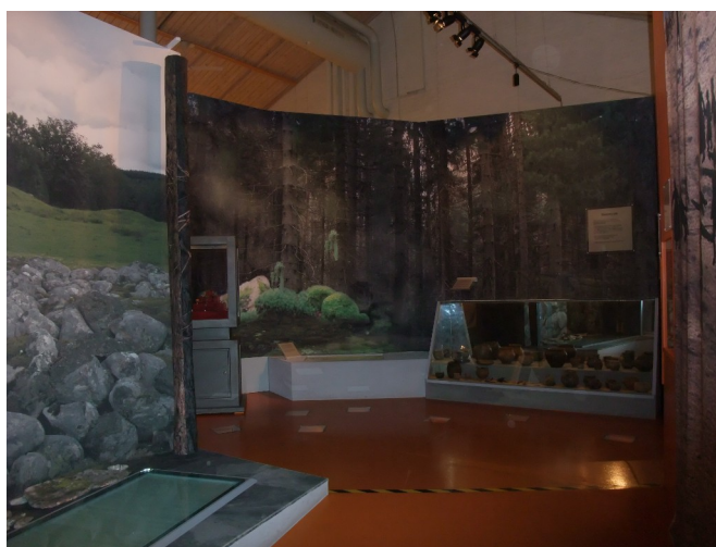
Figur 19 Interiörbild för rummet med tema döden i "Mellan Is och Eld" Fotograf: Pernilla Swanson 17/2 2022

Det finns också en monter full med fragment av brända människoben och djurben, och tillhörande text berättar om kremeringen, det som går att tolka från benfragmenten, och att det ofta påträffas djurben i många gravar. Längst in i denna del av utställningen finns en textskylt med titeln "Dödens eld" som handlar om att de döda oftast brändes under järnåldern och benen samlades i en urna som begravdes i jorden. Under denna text finns en monter full med keramikkarl, metallskäror, och benfragment, och tillhörande text handlar om begravningsätten med brända ben i en urna och olika typer av gravgåvor. I golvet kan besökaren se sju små monstrar med keramikurnor fyllda med benfragment. I en monter i samma rum finns bland annat ett svärd, delar av en sköld, en kniv, och en spjutspets, som enligt en text bredvid hittats i en mans grav i form av en dommarring i Älgårås. Ännu en monter bemöter besökaren och den är full av korsformiga spännen, hästbeslag, en armring, olika formade spännen, hårnålar, pärlor av olika material, fibulor, och liknande. Tillhörande text berättar om dessa föremål och var de hittats.