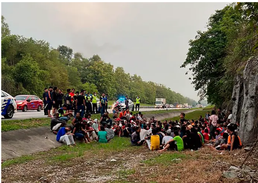
Fotot publicerades i artikeln "Barn döda efter flykt från förvar" i Aftonbladet, 20 april 2022.

arkivfoton, utan avbildar de faktiska händelserna och människorna som avhandlas i artikeltexten. I dessa två artiklar förekommer inga diskrepanser i budskap mellan bild och skrift, utan flyktingarna framställs som relaterbara individer i behov av hjälp i såväl bild som skrift. Tidigare forskning har visat att attityden mot europeiska flyktingar, bland annat i Sverige, är mer positiv än mot icke-europeiska (De Coninck, 2019:1680). Detta kopplas till gestaltningen i media och befolkningens mediekonsumtion (2019:1677).