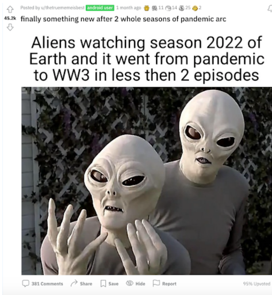
Figur 6.8 Mem 22. “finally something new after 2 whole seasons of pandemic arc”