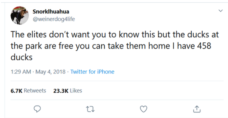
Figur 6.6. Originaltweet

Memen har senare florerat på nätet i flera skepnader, där en vanlig form av memen är en bild på den amerikanska TV-personligheten Alex Jones och en textremsa (Nox Lucis, 2020) (figur 6.7), vilket också är fallet för memen i analysen. Alex Jones är en amerikansk journalist och konspirationsteoretiker, med libertarianska och paleokonservativa politiska åsikter, som äger hemsidan InfoWars vilken har bekräftats sprida många falska nyheter och konspirationsteorier. Han står också bakom konspirationsteorin New World Order som förknippas med vaccinnmotstånd, åsikten om att 9/11 aldrig ägt rum, antisemitism, tron om att världens ledare gått ihop och styr världens befolkning genom vaccinationer, genmanipulering och chemtrails (Wikipedia d, 2022).