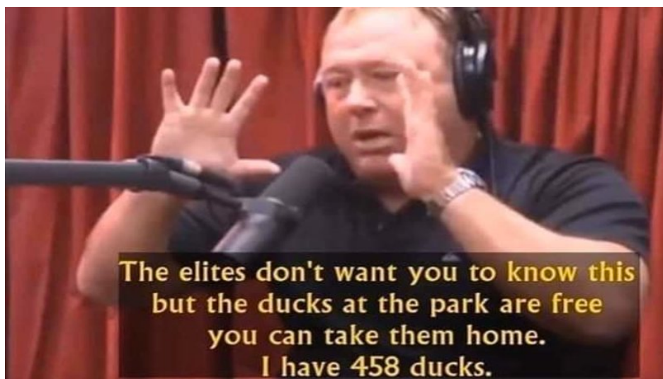
Figur 6.7. "The Ducks at the Park are Free". Originalmem.

Memen har senare florerat på nätet i flera skepnader, där en vanlig form av memen är en bild på den amerikanska TV-personligheten Alex Jones och en textremsa (Nox Lucis, 2020) (figur 6.7), vilket också är fallet för memen i analysen. Alex Jones är en amerikansk journalist och konspirationsteoretiker, med libertarianska och paleokonservativa politiska åsikter, som äger hemsidan InfoWars vilken har bekräftats sprida många falska nyheter och konspirationsteorier. Han står också bakom konspirationsteorin New World Order som förknippas med vaccinnmotstånd, åsikten om att 9/11 aldrig ägt rum, antisemitism, tron om att världens ledare gått ihop och styr världens befolkning genom vaccinationer, genmanipulering och chemtrails (Wikipedia d, 2022).