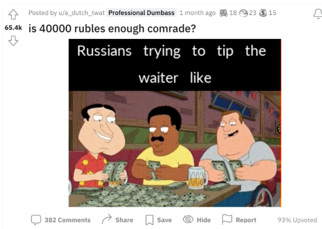
Figur 6.1 Mem 9. “is 40000 rubles enough comrade?”