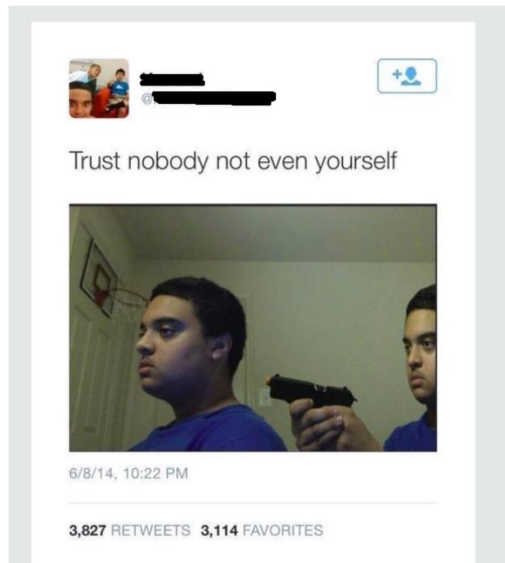
Figur 6.10 “Trust Nobody, Not Even Yourself”. Originalmem (James Blunt, 2015).

Bilden följer mem-formatet “Trust nobody – Not even yourself”, som vanligast förekommer med en liknande bild där kniven är utbytt mot en pistol ( figur 6.10) (James Blunt, 2015) men med bilden i figur 6.9 och formatet. Det finns därför en intertextuell relation mellan denna mem och tidigare mem i samma format. Bilden med pistol är mer vanligt förekommande, men har man sett den bilden innan känner man troligtvis ändå igen formatet.