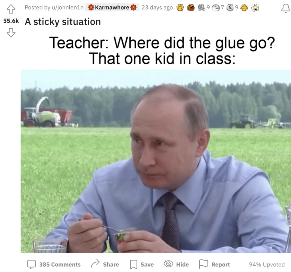
Figur 6.2. Mem 14. "A sticky situation".