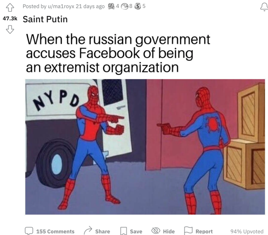
Figur 6.4. Mem 19. "Saint Putin".