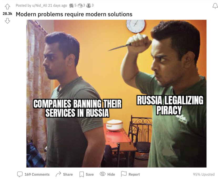
Figur 6.9 Mem 44. “Modern problems require modern solutions”