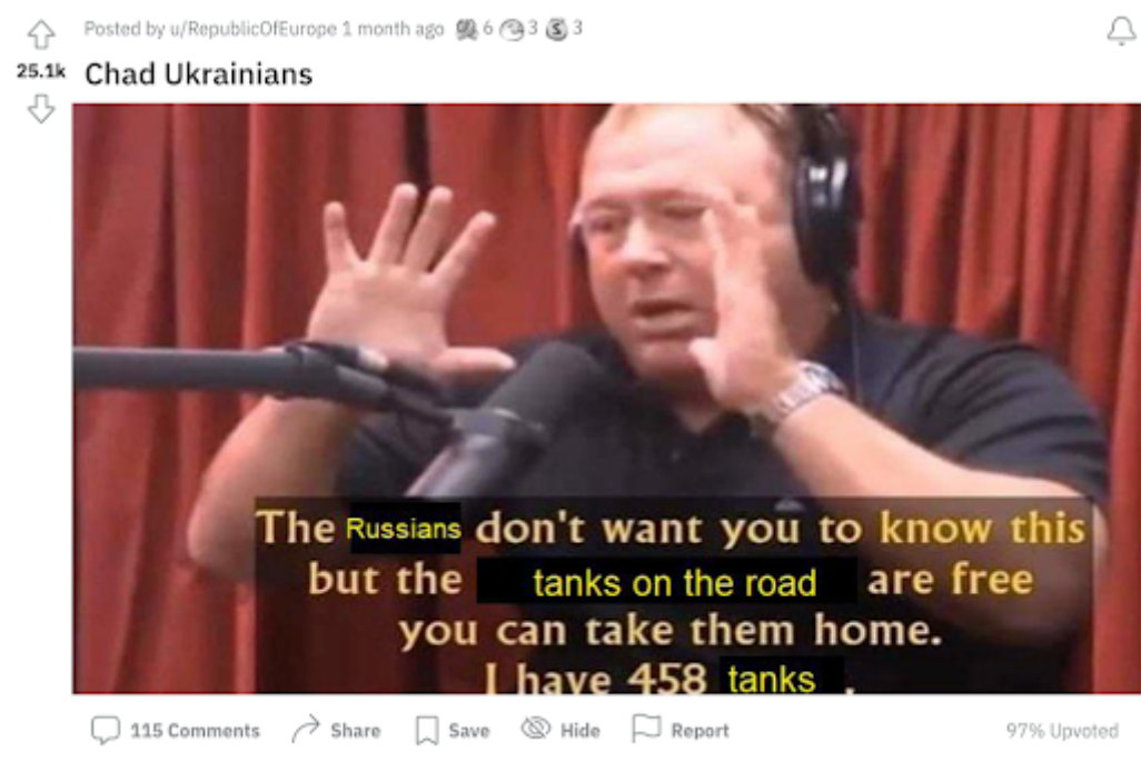
Figur 6.5 Mem 55. “Chad Ukrainians”