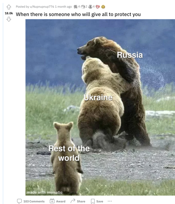
Figur 5.1: Mem 95 “When there is someone who will give all to protect you”

I vissa fall kan det vara svårt att bedöma vilket huvudtema en viss mem tillhör. I dessa fall har vi fått göra vissa överväganden, för att kunna bestämma vilket tema som är det huvudsakliga och vilket som fungerar som stödtema. Ett exempel på detta är mem 95, “When there is someone who will give all to protect you” (figur 5.1), som delvis hyllar Ukraina genom att visa på deras styrka, men också förlöjligar Ryssland genom att visa på deras svaghet, och även förlöjligar resten av världen som framställs som små och beskyddade av Ukraina. I detta fall har vi valt att kategorisera den som en hyllning av Ukraina, eftersom vi anser att det är det mest framträdande budskapet som också bekräftas av rubriken som lyfter just Ukraina. Sekundärteman blir i fallet hur Ryssland framställs som svagt och hur resten av världen framställs som svagt, eftersom de vore svaga utan Ukraina som skyddar dem. Detta bygger på Saldañas (2013:177-180) modell och hur huvudtemat blir vad bilden säger, samtidigt som de bakomliggande påståendena blir sekundärteman.