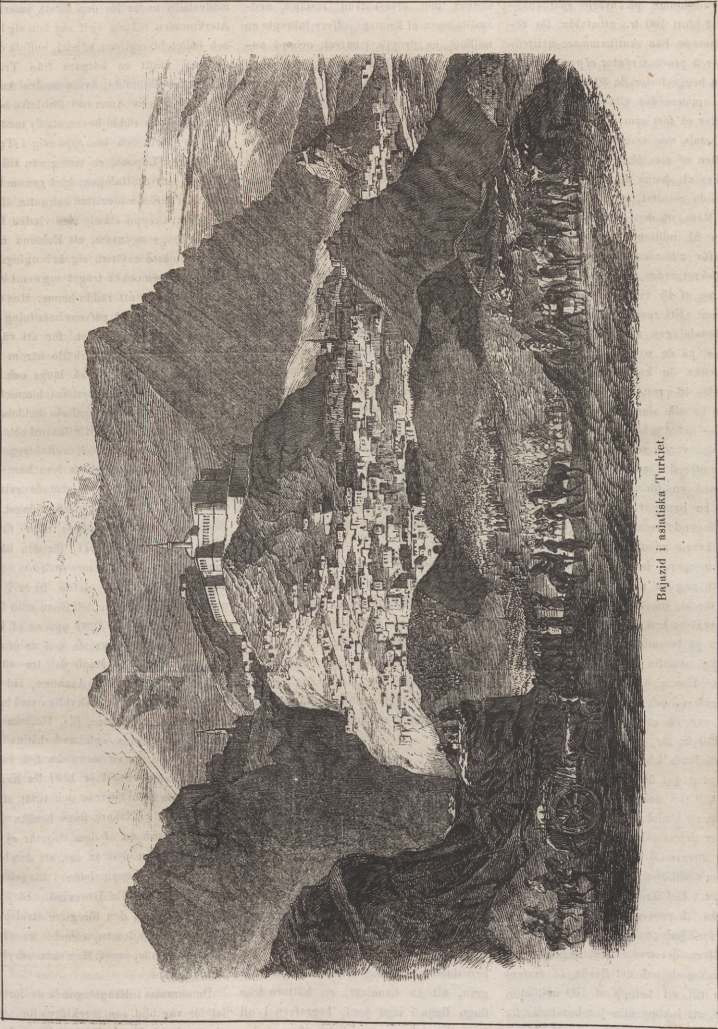
Bajazid i asiatiska Turkiet.