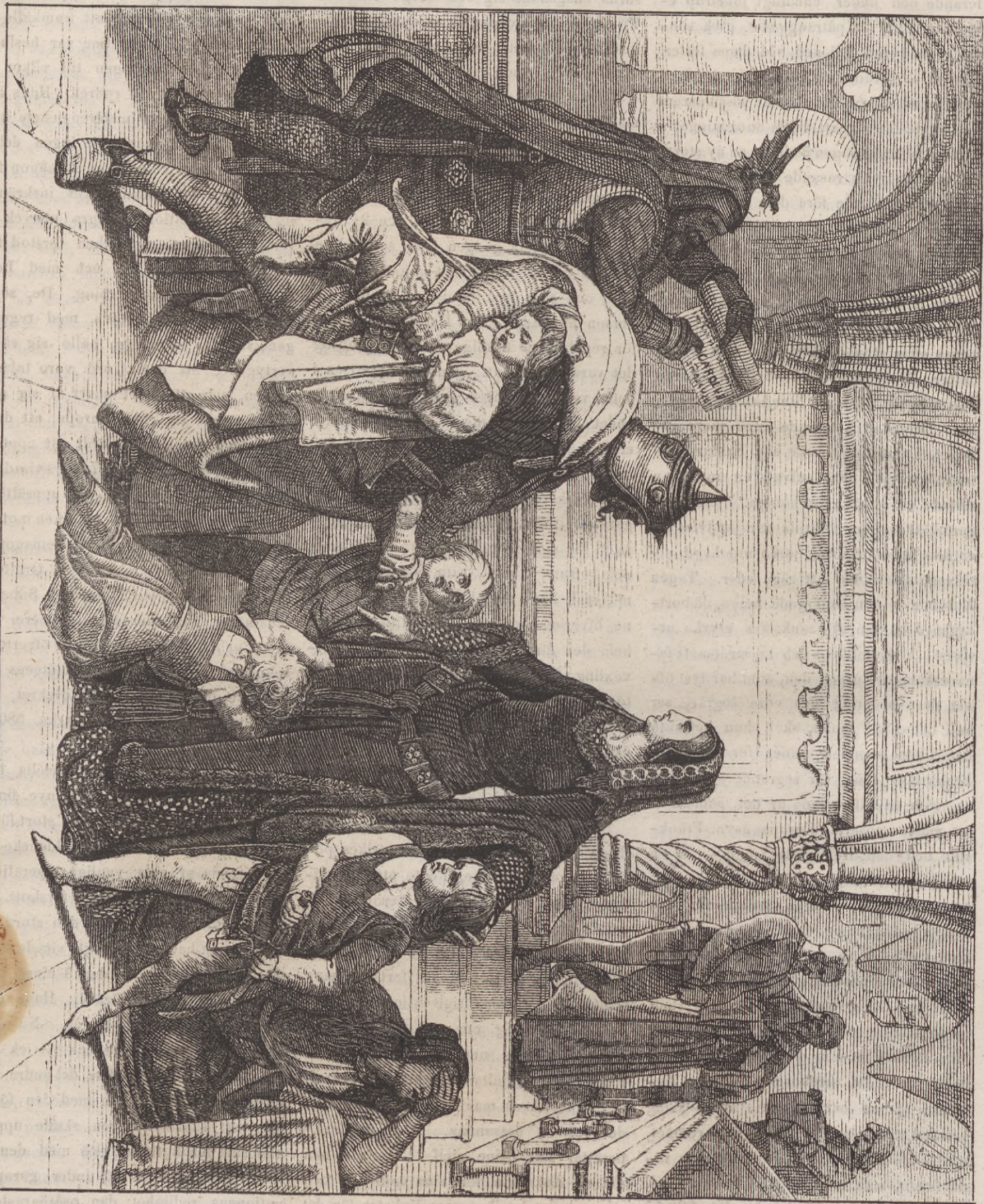
Tillångagatagandet af konung Manfreds af Hohenstaufen familj efter slaget vid Benevent. Målning af Director Engerth i Prag.