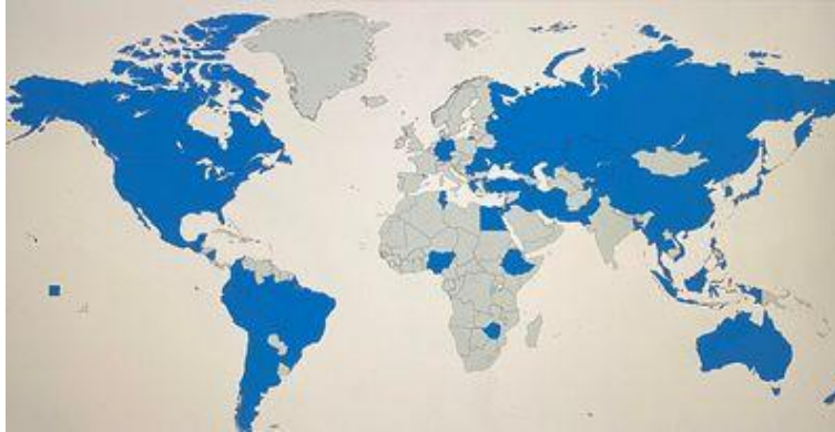
Deltagande i WVS, wave 7.

De blåmarkerade länderna på bilden representerar de länder vars resultat än så länge visats upp i undersökningen. Av intresse så skiljer sig datamängden väldigt från hur många undersökningar av den här karaktären brukar se ut, i vilka Europa ofta brukar vara överrepresenterade. I det här fallet är Europa underrepresenterat, med enbart representation från Andorra, Cypern, Grekland, Tyskland, Rumänien, Ukraina och Ryssland. Detta kan vara problematisk för studien då Europa utgör en stor del av den individualistiska kultursfären. Denna problematik minskas dock något av att erkänt individualistiska länder som USA, Kanada, Australien och Nya Zeeland är representerade, men den bör finnas i åtanke. Asien och Amerika har god representation men datan i Afrika är till stor del även den bristfällig, även ifall några länder som skulle kunna påstås representera större områden deltar. Det bör dock nämnas att urvalet kommer att behöva minskas något när vidare operationaliseringar ska göras, vilket kommer att beskrivas nedan.