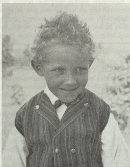
Nya stadsdelar, nya medborgare, nya ungdomsorganisationer — här har vi en av de yngsta folkdansarna

Enligt infordrade uppgifter har ungdomsföreningarna använt anslagen till kontaktsammankomster, arbets-, tränings-, reklam-, upplysnings- och propagandamateriel. Lokalomkostnader utgör ock en betydande utgiftspost. I åtskilliga fall påpekar föreningarna sina svårigheter att få avgiftssystemet att fungera i början av verksamhetstiden. Man menar, att det efter starten ofta förflyter flera månader,