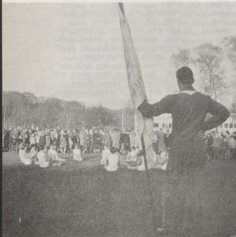
Bland de initiativ från SAM, som de senare åren mest uppmärksammats var ungdomsdagarna i Slottsskogen. Det var skojiga och publika arrangemang.