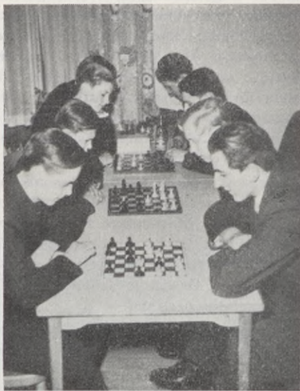
Interiör från ungdomskaféet

organisationerna en vital angelägenhet. Därför söker styrelsen att på alla sätt hjälpa de olika föreningarna att erhålla egna lokalutrymmen antingen på ungdomsgårdarna eller genom samarbete med ett allmännyttigt bostadsföretag få dessa att upplåta vissa lokalerheter i källarvåningarna inom de nya bostadsområden, som skall bebyggas. Så har bl. a. skett i stadsdelen Persborg, där ungdomsstyrelsen medverkat till att åtta nya föreningar bildats och erhållit egna lokaler i bostadsområdet. I centrumanläggningen har ungdomsstyrelsen egna samlingslokaler bestående av en stor samlingshall med scen, vilken sal rymmer 275 personer, 4 mindre salar samt studierum och expeditioner. Ungdomsstyrelsen disponerar över åtta ungdomsgårdar samt ytterligare lokalerheter i skolor och barndaghem. Ungdomsgårdarna är av olika storlekar och är inredda dels i nybyggen och dels i omädrade äldre fastigheter. Den största ungdomsgården är Ungdomens hus med 114 disponibla lokalerheter bestående av klubblokaler, expeditioner, samlingshallar, ungdomskaféet samt styrelsens administrationslokaler. Nyttjat kvadratmeterinnehåll i