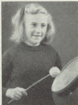
Rytmorkestern — ett fint programinslag.

Förlaget har också material av annorlunda uppläggning. Bl. a. finns en serie kallad Människor , i vilken skildras några av vår kulturs stora: Gandhi, Nansen, Curie, Schweitzer o. a. (20 st.). Varje häfte är skrivet så att det ska passa som stoff till elevföredrag (—: 35).