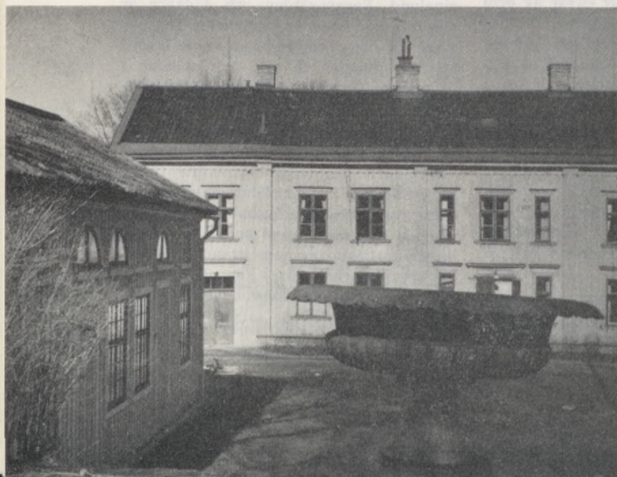
Ett gammalt landeri som blivit ungdomsgård: Stora Katrinelund.

När började ungdomsgårdarna arbeta här i staden? Ungdomsgårdsarbetet i staden har anor ända från 1919, då Studiehemmet Nordgården, som fortfarande betjänar Nordstaden och dess ungdomar, började sin verksamhet. Den moderna ungdomsgårdsepoken inleddes i och med starten av Lundby ungdomsgård 1933. Bagaregården, Burås och Majorna startade också under trettioalet. Fyrtioalet födde landeri-gårdarna Källtorp och Katrinelund. I början av femtioalet ökades takten högst avsevärt. Hälften av nuva-